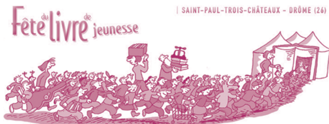
ill. Bruno Heitz

Programme détaillé de la manifestation sur le site : www.slj26.com/www Renseignements : inscription aux journées auprès de Fête du livre de jeunesse – 26130 Saint-Paul-Trois-Châteaux. Tél. : 04 75 04 51 42 Fax : 04 75 04 58 99 Courriel : slj26@wanadoo.fr