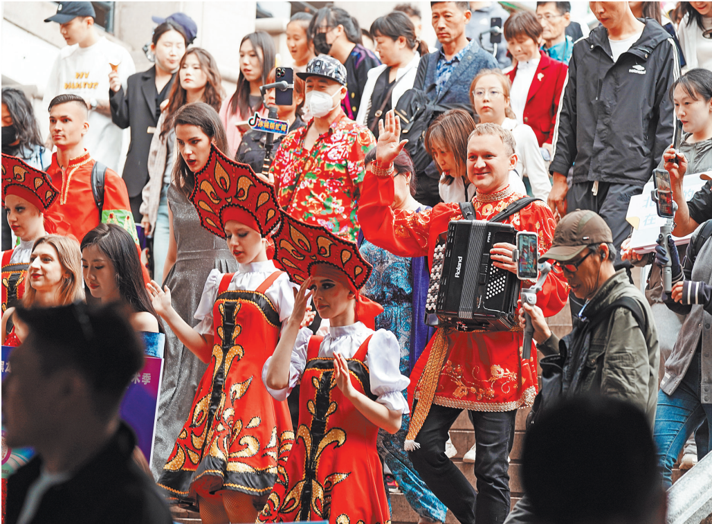
Российские артисты с удовольствием приняли участие во втором Сезоне культуры и искусства регионов Китая и России в Харбине, проходившем в июне этого года в провинции Хэйлуцзянь.

на границе с Россией, зафиксировал более 360 тысяч пересечений границы с января по конец июля — в три раза больше, чем за аналогичный период прошлого года. В прошлом году 317 тысяч человек, посетивших Хэйлуцзянь, или более 90 процентов всех зарубежных туристов провинции, как сообщает газета «Жэньминь жибао», были из России.