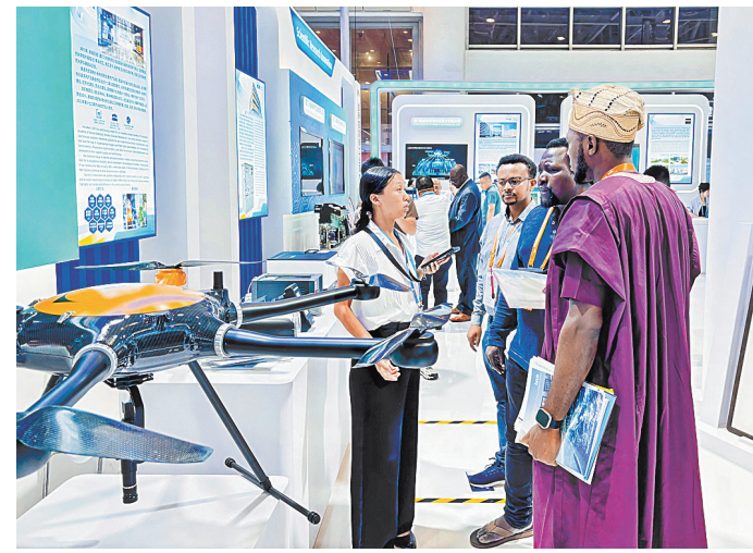
Представитель компании демонстрирует продукцию на выставке новой индустриальной революции БРИКС в Сямэне, провинция Фуцзянь, сентябрь.

В прошлом году БРИКС создали группу по изучению ИИ для продвижения инноваций и сотрудничества среди стран — членов объединения. Создание группы формализовало и укрепило сотрудничество стран БРИКС в области ИИ, предоставив структурированную платформу для обмена знаниями и ресурсами среди стран-членов. Ожидается, что группа сыграет ключевую роль в формирова-