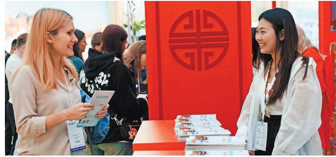
Посетители на китайском стенде во время 30-й международной ярмарки путешествий и туризма в Москве, 17 сентября.

Дикие животные могут использовать коридоры, которые открыты через каждые несколько сотен метров вдоль границы, для перемещения между двумя странами, добавил Фэн. Благодаря совместному механизму охраны численность основных видов добычи для тигров и леопардов, таких как пятнистые олени, дикие кабаны и косули, в национальном парке увеличилась в два раза.