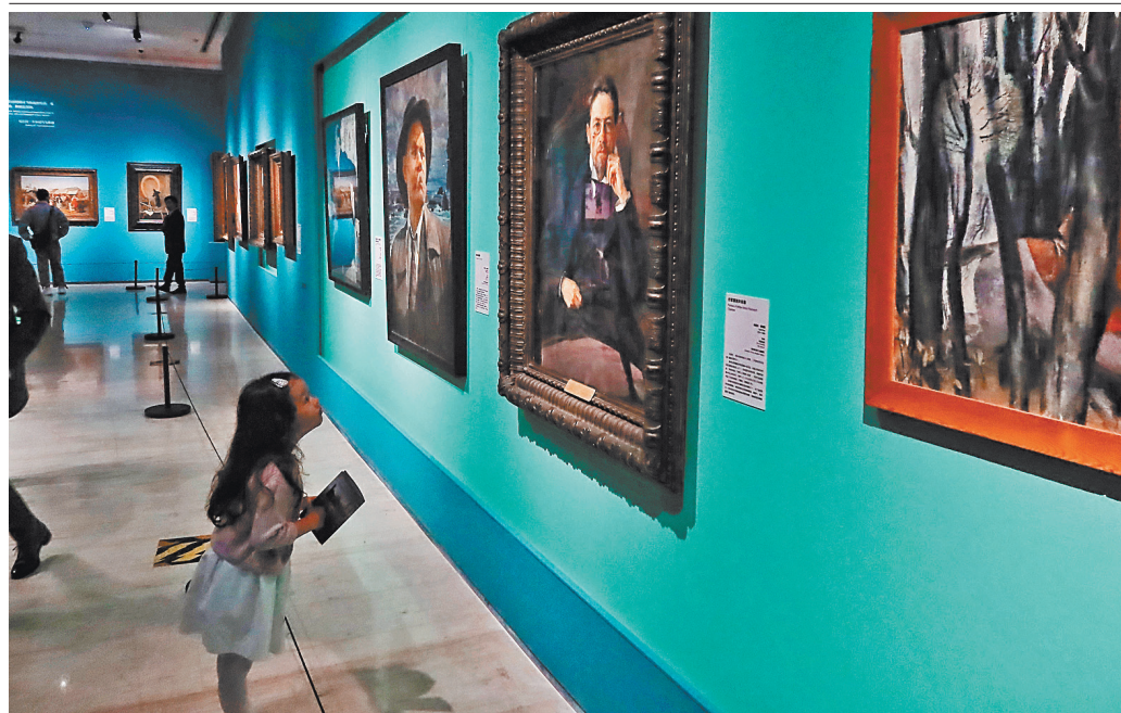
Выставка «Душа России», проходящая в Столичном музее в Пекине, представляет коллекции из московской Государственной Третьяковской галереи.

В 1856 году московский купец Павел Третьяков приобрел два произведения русских художников: «Стычка с финскими контрабандистами» В.Г. Худякова и «Искушение» Н.Г. Шильдера. Для 24-летнего Третьякова это стало первым шагом в мир серьезного искусства.