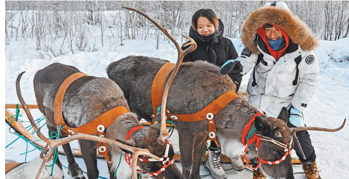
В Мурманской области проводятся экскурсии, во время которых китайские туристы могут узнать много интересного о северных оленях.