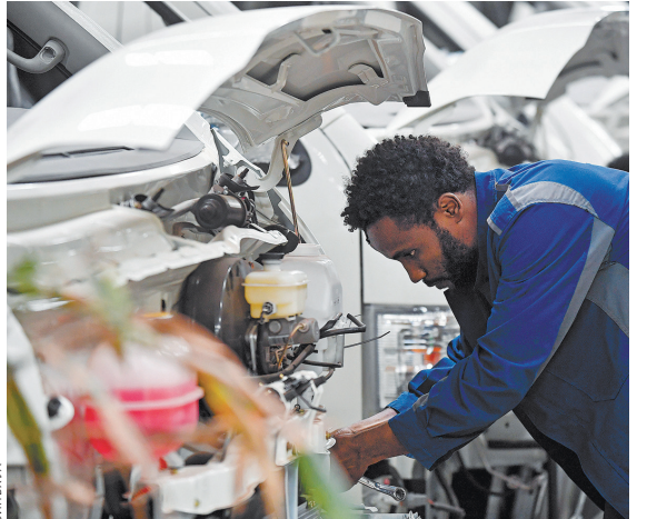
Работник на конвейере электрических автобусов, компоненты которых импортируются из Китая. Аддис-Абеба, Эфиопия.

Расган Махарадж, генеральный директор Института экономических исследований в области инноваций при Техническом университете Цяне (ЮАР), отметил, что БРИКС поддерживает эти страны в модернизации их промышленного потенциала, развитии цифровой экономики и продвижении инноваций.