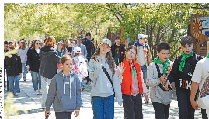
Российские туристы посещают Китайско-российский парк национальных традиций в Хэйхэ, провинция Хэйлуцзянь.

июня по август, в пиковый сезон летнего туризма, китайско-российскую границу в Хэйхэ пересекли 264 882 путешественника. Город популярен среди китайских туристов благодаря своему расположению и русской архитектуре, придающей городу особый шарм. В первые семь месяцев года в Хэйхэ было зарегистрировано более 12 миллионов туристов, что, по данным городского управления