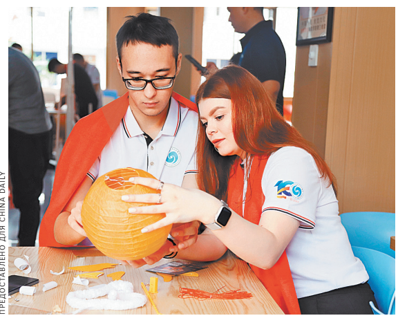
Студенты из России делают фонарики в Хайнаньском институте программных технологий в городе Цюанхай, провинция Хайнань, февраль.

Помимо базовых курсов китайского языка, учебная программа для иностранных студентов включает модули по китайской культуре и знакомство с обществом Хайнаня и туристической отраслью провинции. Программа также включает занятия по таким темам, как культура китайского чая, каллиграфия, живопись, кулинария, культура вина, музыка и тайцзицюань.