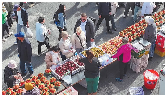
Путешественники из России покупают фрукты на утреннем рынке в Хэйхэ, провинция Хэйлуцзянь.

культуры, радио, телевидения и туризма, на 41,8 процента больше, чем за аналогичный период прошлого года. Туризм принес доход в размере 9 миллиардов юаней, это более чем вдвое превышает показатели за аналогичный период прошлого года. «Улучшение транспортной инфраструктуры и более тонко настроенная туристическая политика играют важную роль в повышении