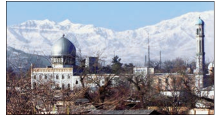
Ya’küb-i Çerhî Camii ve Medresesi – Duşanbe

Özbekistan Sovyet Sosyalist Cumhuriyeti’ne baġlı Otonom Tacik Sovyet Sosyalist Cumhuriyeti’nin ve 1929’da Tacikistan Sovyet Sosyalist Cumhuriyeti’nin başşehir oldu. Stalin’in adına izâfeten şehrin ismi Ekim 1929’da Stalinâbâd olarak deġiştirildi.