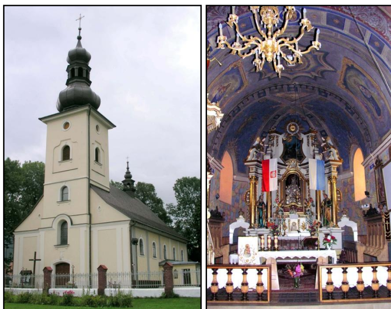
Kościół św. Jakuba

. Góry te, to kolejne istotne miejsce na mapie dziedzictwa kulturowego wsi. Groń Jana Pawła II to dawna Jaworzyna. Jednak dla upamiętnienia częstych wizyt Karola Wojtyły na tym szczycie oraz pobliskim Leskowcu, wystąpiono o zmianę nazwy. Lokalni działacze społeczni wznieśli na jego szczycie sanktuarium górskie .