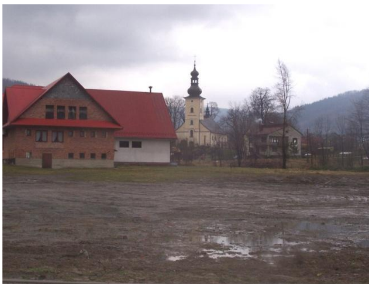
Obecne centrum miejscowości

Miejsce, w którym odbywają się wszystkie kulturalne wydarzenia, oraz organizowane są się zajęcia pozalekcyjne dla dzieci i młodzieży to Świetlica. Tu także spotykają się lokalne organizacje społeczne. Należy zaznaczyć, że nie spełnia już ona oczekiwań pod względem powierzchni oraz wyposażenia. Na terenie wsi, tuż przy szkole, w 2010 roku powstał nowy obiekt sportowy ORLIK. Wieś nie posiada skweru, parku, ani także ścieżek rowerowych. Centrum wsi jest całkowicie niezagospodarowane, zaniedbane i oszpecone. Tereny zielone centrum wymagają głębokiej rewitalizacji. Niezbędne jest stworzenie parkingu, oraz miejsca do wypoczynku dla rodzin.