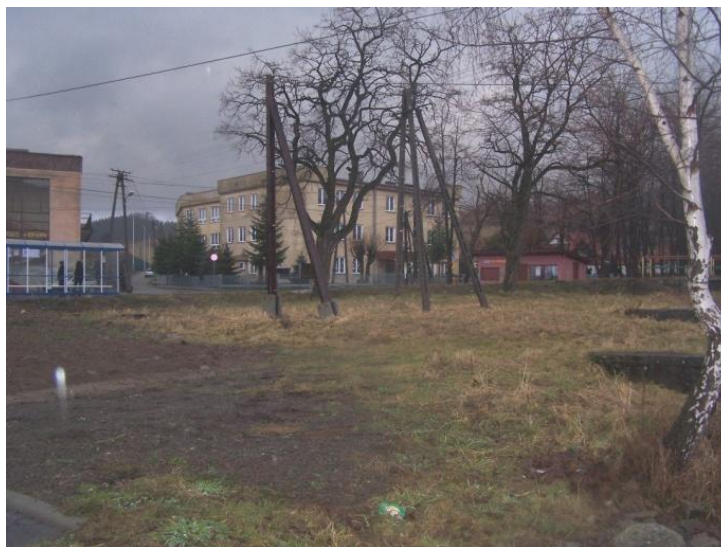
Ścisłe centrum miejscowości

Dodatkowy atut to fakt posiadania niezagospodarowanego dużego obszaru w samym centrum wokół strażnicy OSP. Będzie można tutaj utworzyć założenie parkowe służące mieszkańcom i turystom. Uroku temu obszarowi dodaje przyływająca obok rzeka Rzyczanka. Obecnie obszar ten nie wygląda imponująco jednak posiada ogromny potencjał rozwojowy.