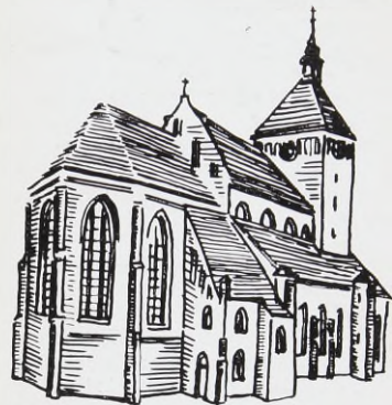
KOŚCIÓŁ NMP w Darłowie Zabytek z XIV w.