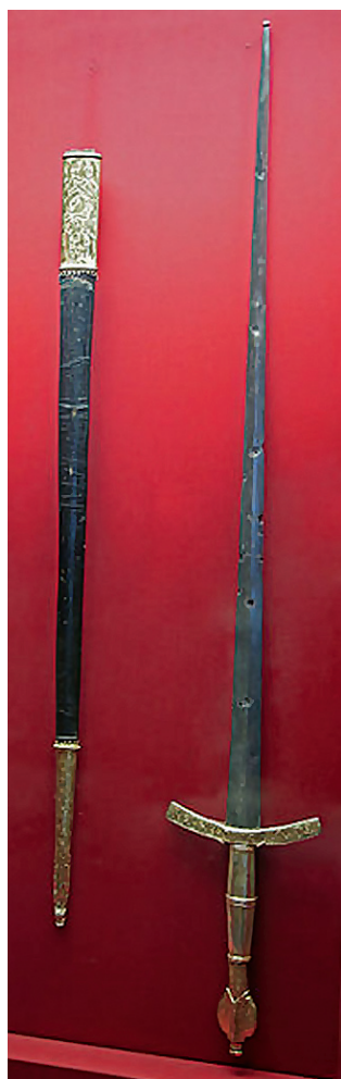
Ceremonijalni mač dubrovačkoga kneza, dar ugarsko-hrvatskoga kralja Matije Korvina (Kunsthistorisches Museum, Beč)

nije, koji su u svojoj djelatnosti bili odgovorni staležima i redovima. Sabor je nadalje određivao delegate u pojedinim poslovima utvrđivanja granice, odnosima s vlastima u Vojnoj krajini i susjednim pokrajinama, brinuo se za sanitarne prilike, održavanje i uređenje prometnica, čuvanje najvažnijih dokumenata Kraljevstva, održavanje arhiva i registratura, te je rješavao razne sporove vezane uz plemićke nekretnine. U suradnji s banom brinuo se o upravi Banske krajine, a do preustroja županija i o upravi Zagrebačke i Križevačke županije. No, najvažniju djelatnost Sabora predstavljala je porezna uprava Kraljevine: staleži i redovi svake su godine donosili godišnji proračun Kraljevstva, provodili reparticiju poreza po županijama i gradovima te odobravali sve izdatke. Ovdje je bitno napomenuti da se porezna uprava Sabora odnosila samo na područje hrvatskih županija (slavonske su županije prilikom inkorporacije u fiskalnim pitanjima podvrgnute Ugarskom namjesničkom vijeću). U svim je poslovima Hrvatski sabor kao staleško reprezentativno tijelo komunicirao s vladarom posredstvom Ugarske dvorske kancelarije te s ostalim institucijama vlasti – Dvorskom komorom, Dvorskim ratnim vijećem, Unutarnjoaustrijskom vladom i drugima.