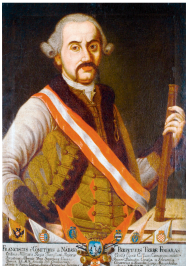
Portret grofa Franje Leopolda Nádasdyja (Magyar Nemzeti Múzeum, Budimpešta)

Grof Franjo Leopold Nádasdy Fogáras (Radkersburg, 1708. – Karlovac, 1783), hrvatski ban od 1756. do 1783. Tijekom njegova banovanja provedene su brojne reforme u Bansknoj Hrvatskoj – preustroj županijske uprave, osnutak i ukidanje Hrvatskoga kraljevskog vijeća te odvajanje izvršne od zakonodavne vlasti, reforme porezne uprave, reforme školstva, pravosuđa i javnoga zdravstva.