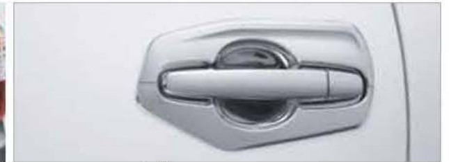
Chrome Door Housing (Set) PZ042-0K505-TM