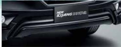
Front Bumper Spoiler (Set)