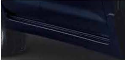
Side Skirt PZ039-0K501-TM