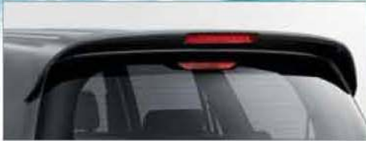
Rear Roof Spoiler (Set)