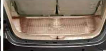
Luggage Tray PZ002-0K501