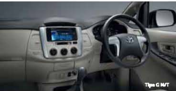
Tipe G M/T