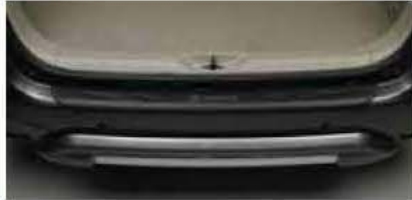
Rear Bumper Step Cover PZ050-0K501