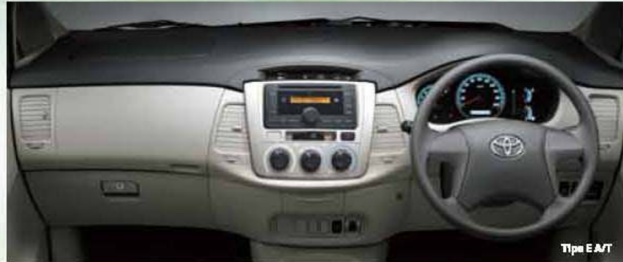
Tipe E M/T