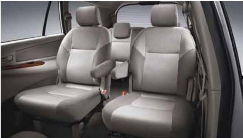
Captain Seat - Tipe G (Set) 71005-TA055