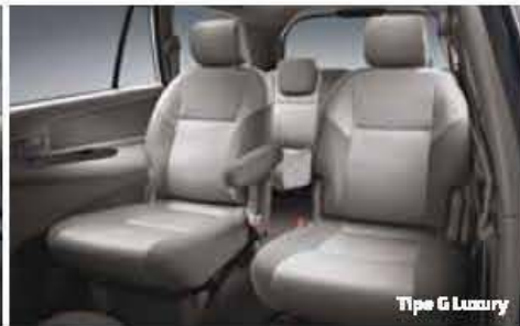
Tipe G Luxury