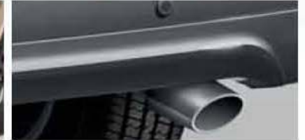
Muffler Cutler PZ056-0K009