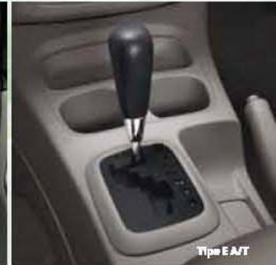
Tipe E A/T