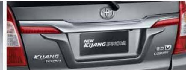
New Back Door Garnish Panel