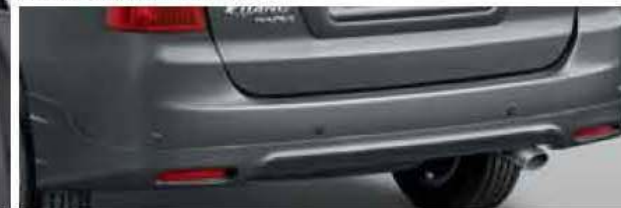
Rear Bumper Spoiler PZ036-0K503-TM