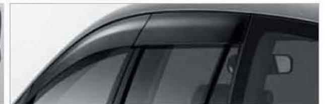
Side Visor (Set) PZ033-0K502-TM