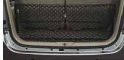
Cargo Net PZ003-0K001