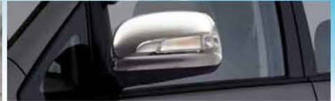
Cover Mirror Painted with Turning Signal Lamp 87910-TA050