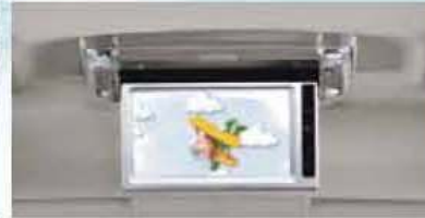
Rear Seat Entertainment