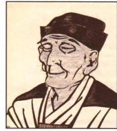
Портрет Матсuo Басё

فهذه الممارسات القاتلة والتضحيات السلبية لا فائدة منها سوى الحسارة، فالاعتدال بكل شيء مطلوب، حتى في المشاعر صحيح أن الرجل بطبيعته يجب أن يأخذ أكثر مما يعطي، والمرأة بالعكس تحب أن تعطي أكثر مما تأخذ، وهنا يجب أن توازني عزيزتي الزوجة حتى تصلي لدرجة التلاقي بينكم..