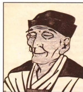
Портрет Мацуо Басё

فهذه الممارسات القاتلة والتضحيات السلبية لا فائدة منها سوى الخسارة، فلا اعتدال بكل شيء مطلوب، حتى في المشاعر صحيح أن الرجل بطبيعته يجب أن يأخذ أكثر مما يعطي، والمرأة بالعكس تحب أن تعطي أكثر مما تأخذ، وهنا يجب أن توازن عزيزتي الزوجة حتى تصلي لدرجة التلاقي بينكم..