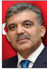
عبد الله جل الرئيس التركي السابق

العربي -الديمقراطية، والحكم الرشيد، وحقوق الإنسان، والشفافية، والمساواة بين الجنسين، والعدالة الاجتماعية- سوف تستمر في تشكيل الأجندة الإقليمية.