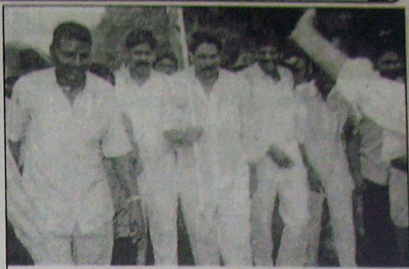
నెల్లూరు టౌన్లో వానల్లో తడుస్తూ పొదయాక్ర అరుపుతున్న ఆగుం నోదర క్రియం, తొమ్మిది పూటకూరు లక్ష్మయ్య

రిపేర్ కోసం నాలుగు నెలలకు పైనుంచి ఎండ బెట్టి వుండిన సర్వేపల్లి కాలువకు 7తేది ఉదయం నీళ్లు వదిలారు