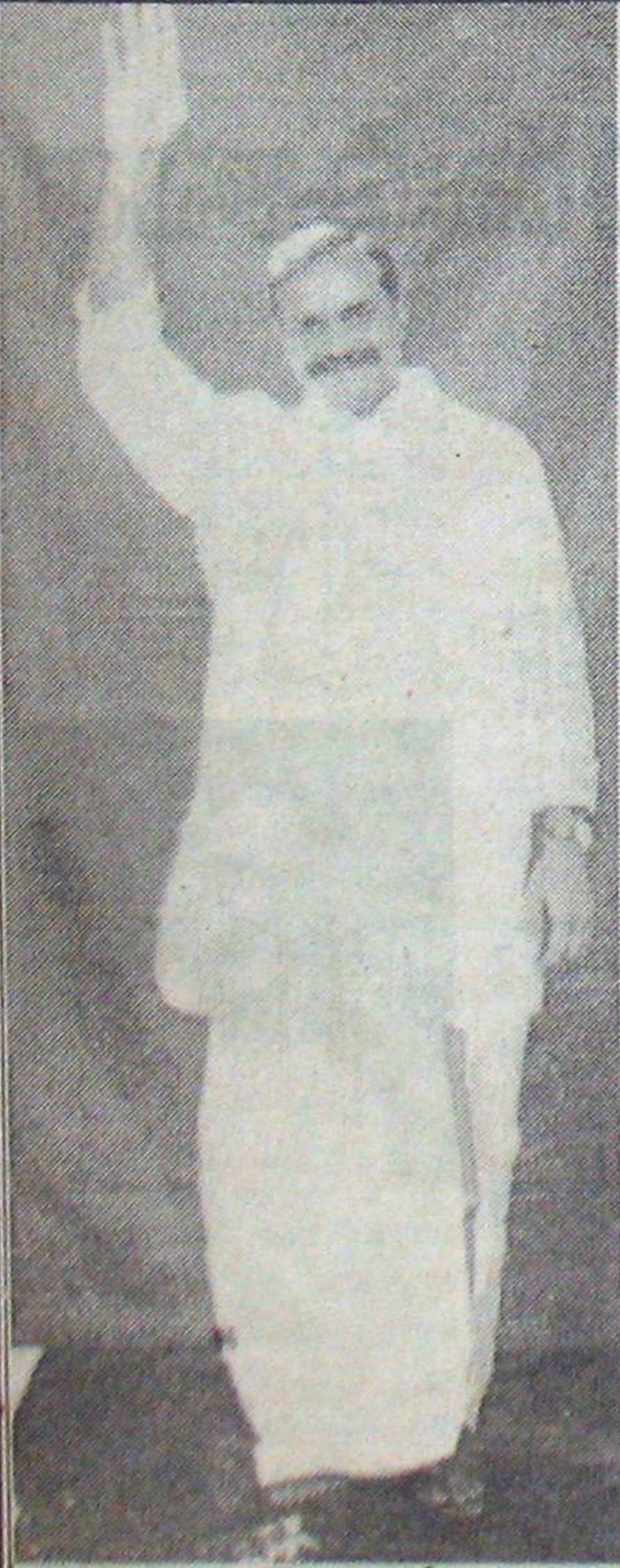
శ్రీ వై.యస్. రాజశేఖరరెడ్డి పి.సి.సి. అధ్యక్షులు.

దురాక్రమణదారులకు అభయం లభించింది! అయితే సై ఆర్డరు వచ్చింది - 7వ పేజీ కండ్రేరు భూముల దురాక్రమణదారులకు రాహుల ఎమ్మెల్యే హుకుం ఖాల్ చేశారట! అప్పటికి రోయ్యల వెంపకం ప్రారంభమైన చెరువులకు మాత్రమే. కాని ఎమ్మార్వో, కొరవ 7వ పేజీలో