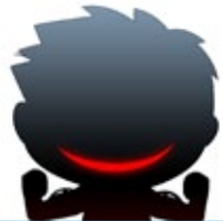
蒼月タカオ グラフィック

PROFILE : TYPE-MOON 所属のクリエイター。 グラフィックチームには、「Fate/stay night」(04年)の 後期からの参加。 グラフィック作業全般を担当する。