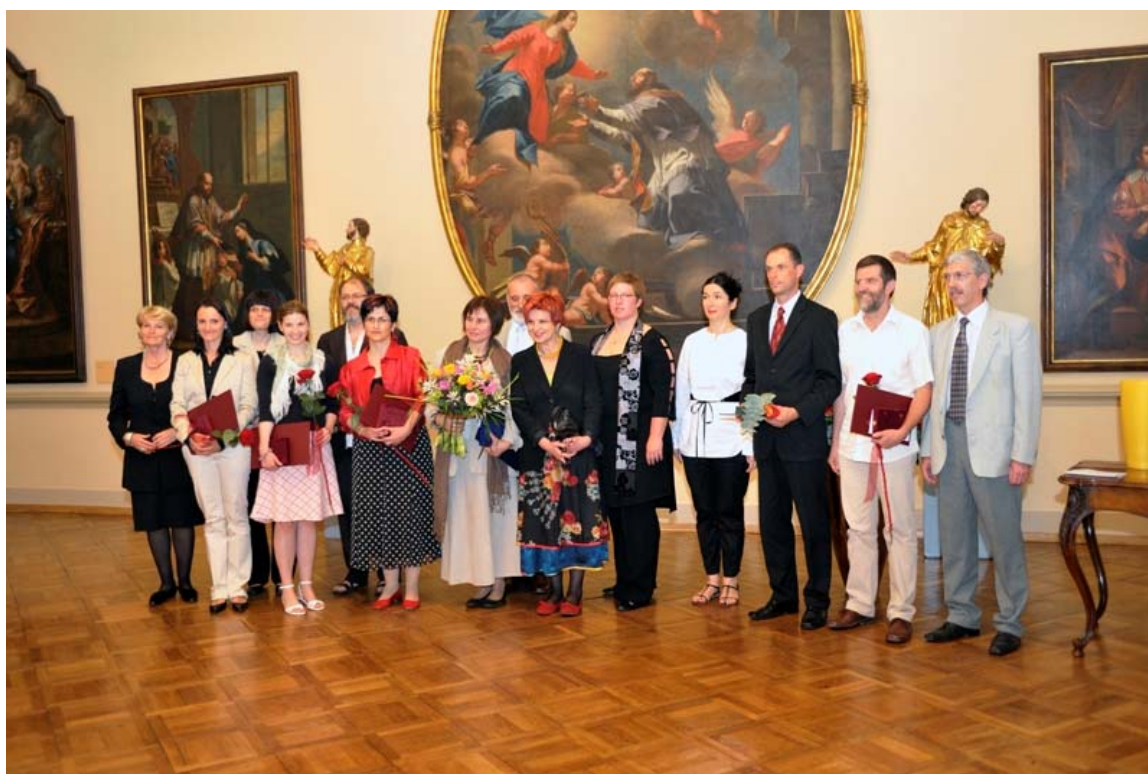
Valvasorjevi nagrajenci v letu 2009