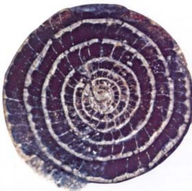
Foraminifera Assilina medanica Pavlovec, 1974