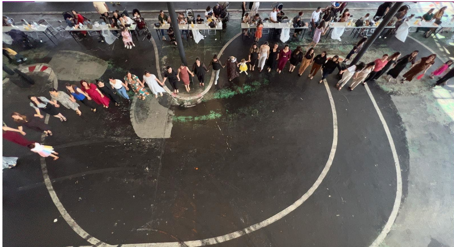
祝事ではダンスを踊る。埼玉県内撮影。