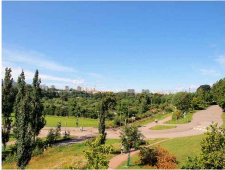
Kuva Kumpulan kartanon laakso Hämeentien sillan suunnalta nähtynä (kesä 2010)