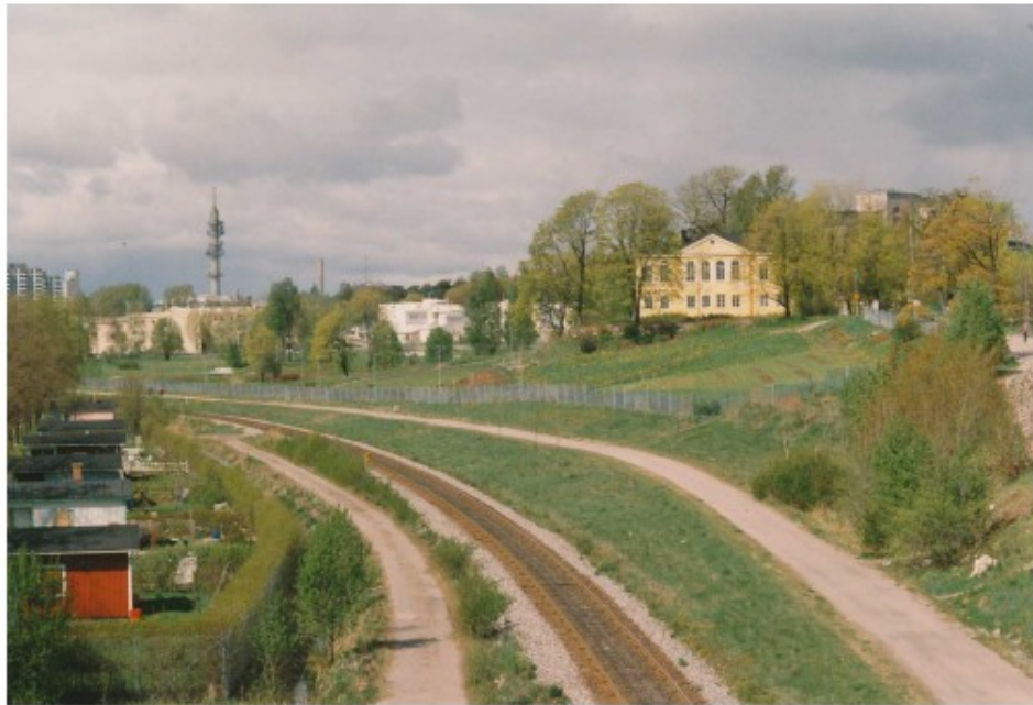
Kuva 13 Satamarata, noin 1990-luvun loppupuolelta

Laakson vilkkaassa käytössä oleva kaupunkipuisto, jota on kehitetty 1980-luvulta alkaen. Puisto muodostaa vihreän väylän Vallilan ja Itä-Pasilan kivi- ja puukaupungista Vanhankaupungin lahdelta, Viikkiin ja Vantaanjoen