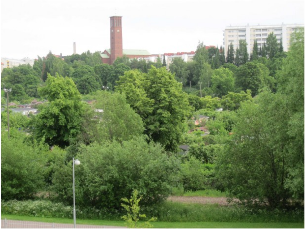
Kuva 8 Paavalinkirkon torni taustalla, Vallilan siirtolapuutarhaa etualalla