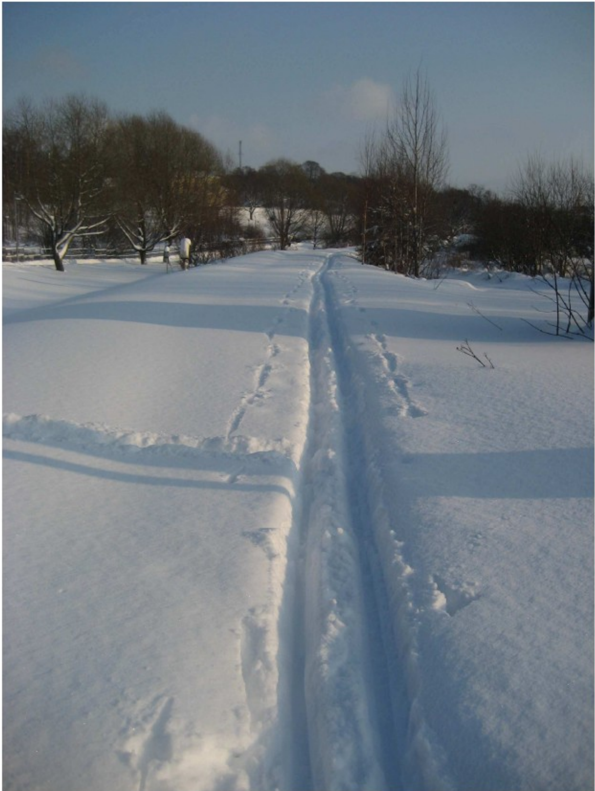
Kuva Satamaradalle löytyi käyttöä heti junaliikenteen loputtua (talvi 2009)