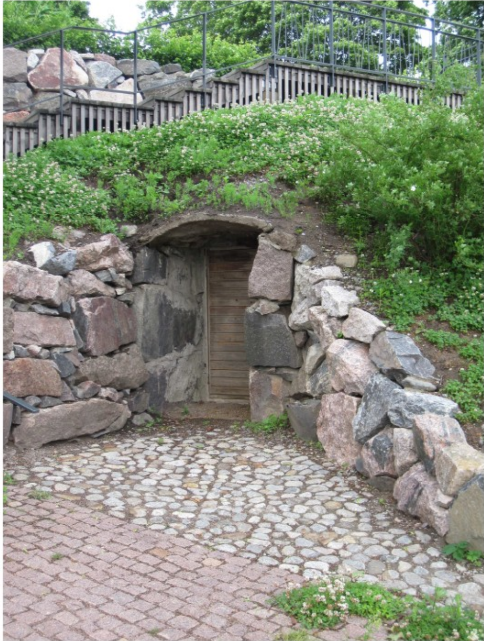
Kuva 2 Vanha kellari

kasvitieteilijänä tutkimusmatkalle Lähi-Itään ja kuoli 1763 Jarimissa, nykyisessä Etelä-Jemenissä. Hänen matkapäiväkirjansa vuosilta 1761 - 1763 julkaistiin vuonna 1950 nimellä Resa till lycklige Arabien . Matkaa kuvaa myös kirjailija Thorkild Hansen fiktiivisessä, mutta historiatietoihin perustuvassa matkaromaanissaan Det lykkelige Arabien (suomentanut Marja Niiniluoto, WSOY 1963).