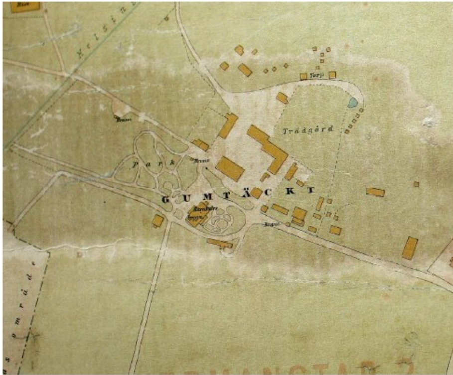
Valokuva Kumpulaa esittävästä kartasta vuodelta 1892