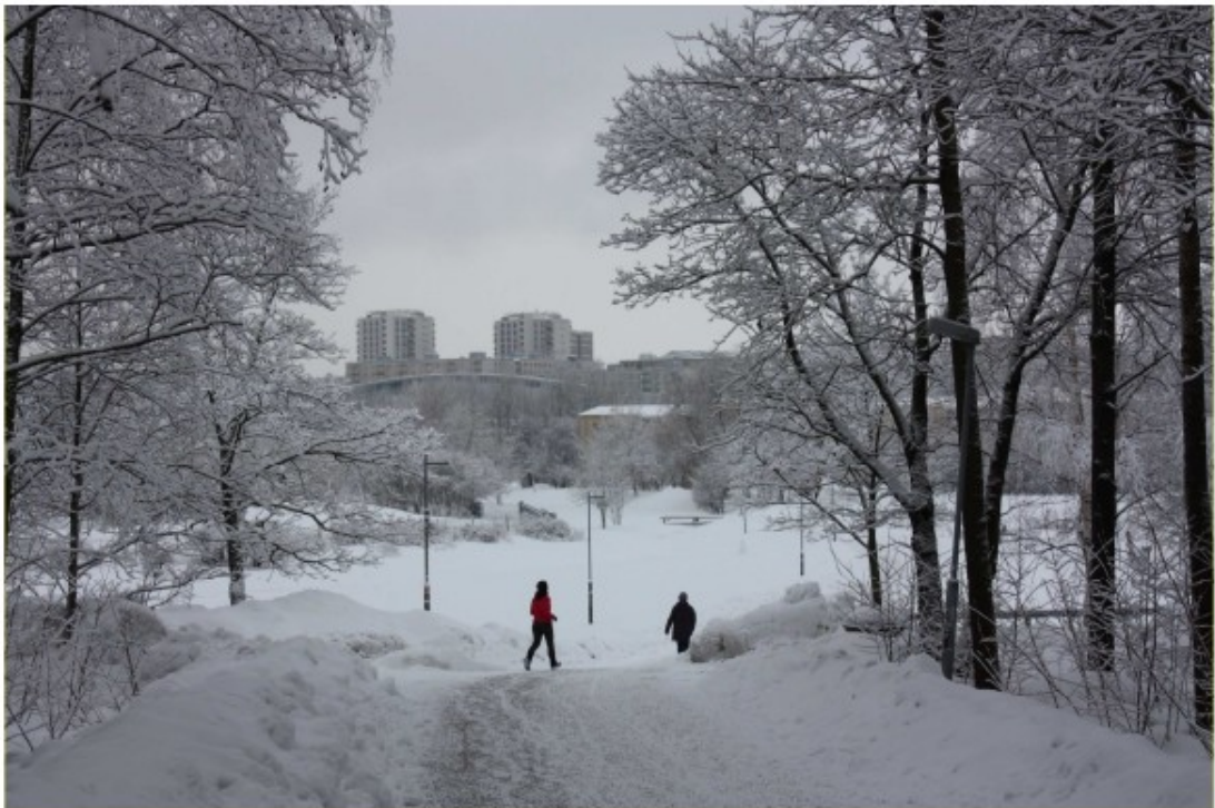
Kuvat 14 ja 15 Näkymä Kumpulantaipaleelta laaksoon kesällä ja talvella