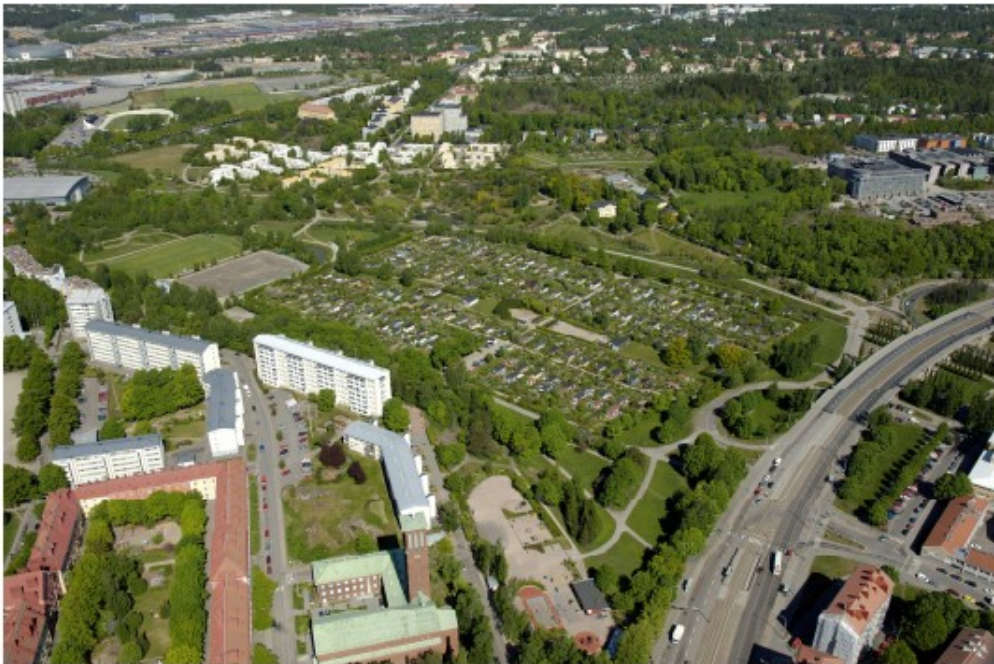
Kuva Yleiskuva alueesta