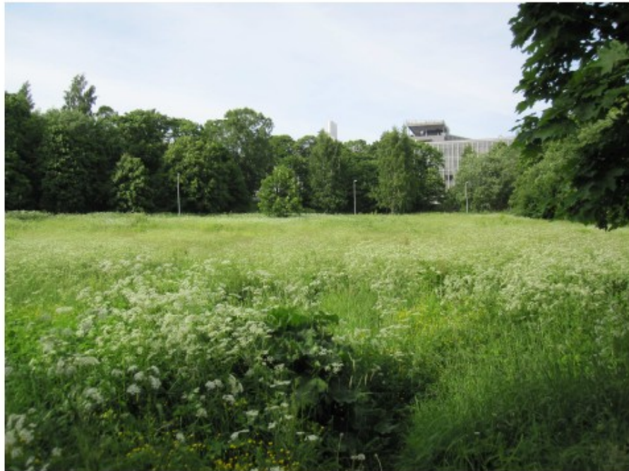
Kuva 1: Nylanderin niitty Ilmatieteenlaitoksen suuntaan nähtynä

hirsirakennuksista koostuva kylä Kumpulanmäen etelärinteellä. Laakson alemmat osat ovat olleet veden alla. Nykyisin Kumpulan kartanoa vastapäätä Jyrängöntien toisella puolella on suojainen metsän ympäröimä niitty, kartan mukaan osa Nylanderin puistoa. Todellisuudessa alue on vuosisatoja viljelyksessä ollut pelto, jossa nyt kasvaa aikaisemmin viljeltyjä kasveja ja uusia valloittajia, pujoa, koiranputkia, nokkosia, takiaisia. Myös kartanoajalta peräisin olevia rakennusten pohjia ja viljelyaloja on havaittavissa. Rehevästä maasta on kaupunginpuutarhassa suunniteltu kunnostettavaksi kärhöpuisto (liite 8). Kevyen liikenteen väylä Jyrängöntieltä Kumpulanmäelle on valmistunut keväällä 2010.