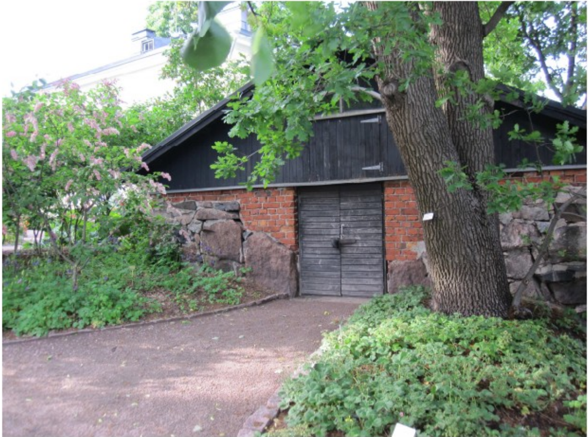
Kuva 6 Tiilirakennus

Lähellä pääporttia on asuintalo, ns. siipirakennus, joka on rakennettu samoihin aikoihin kuin kartanon päärakennus. Se on ilmeisesti ollut henkilökunnan asuinrakennus ja vierastalo, sairaalavaiheessa myös konttori. Kansakoulun aikana siinä asui kaupungin vuokralaisia. Nykyisin talossa on yliopiston vierashuone ja henkilökunnan asuntoja. Aivan pääportin pielessä oleva harmaakivi-tiilirakennus oli alun perin kartanon juureskellari. Sairaala-aikana kellaria käytettiin ruumishuoneena ja nykyisin kasvitieteellisen puutarhan varastotilana.