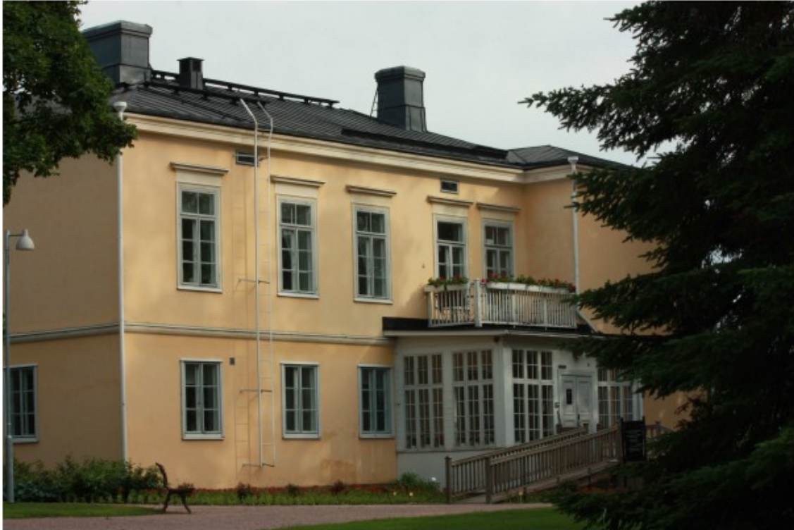
Kuva 4 Päärakennus

Erotuksena useimpiin muihin kartanokokonaisuuksiin Kumpulaa hallitsee epäsymmetrisyys ja vapaa sommittelu. Päärakennusta ei ole kulkusuuntiin nähden keskeisesti sijoitettu. Rakennus pikemminkin avautuu laaksomaisemaan kuin muodostaa päätteen tulijan katseelle. Pihapiirin rakennukset on sijoitettu epäsymmetrisesti toisiinsa ja päärakennukseen nähden. Näin kuitenkin rakennusten ja ympäröivän luonnon suhde entisestään korostuu. Niukkana säilyneen kartta-aineiston perusteella voi päätellä, että kartanoon on luoteispuolelle liittynyt säännöllisesti jäsentynyt puutarha jossa koristekasvien lisäksi on mahdollisesti ollut ajalleen tyypillisiä viljelmiä, kuten kaalimaa, humalatarha, keittiökasvitarha ja hedelmäpuita. Vasta nykyisen päärakennuksen rakentamisen jälkeen 1840-luvun alkupuoliskolla on kartanopiiriin liitetty romanttinen pienoispuisto kiemurtelevine käytävineen, pensaineen ja jalopuineen. Tällöin on rakennuksen eteen samalla liitetty symmetrinen etuistutus.