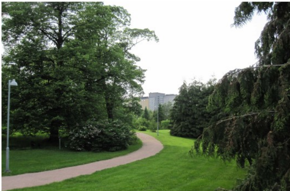
Kuva 9 Näkymä kasvitieteellisestä puutarhasta Kättilöopiston suuntaan