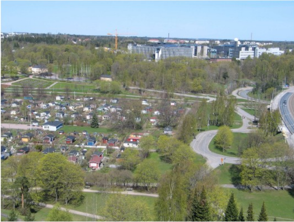
Kuva Vallilanlaakso Paavalinkirkon tornista kuvattuna (kesä 2010)