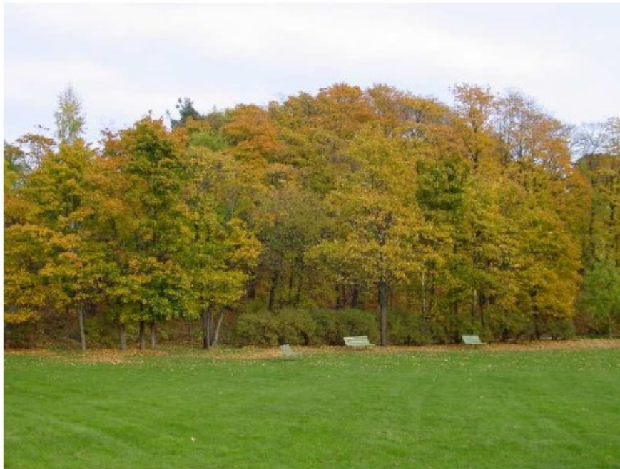
Kuva Kumpulanmäen vaahterametsä kätilöopiston suunnalta nähtynä