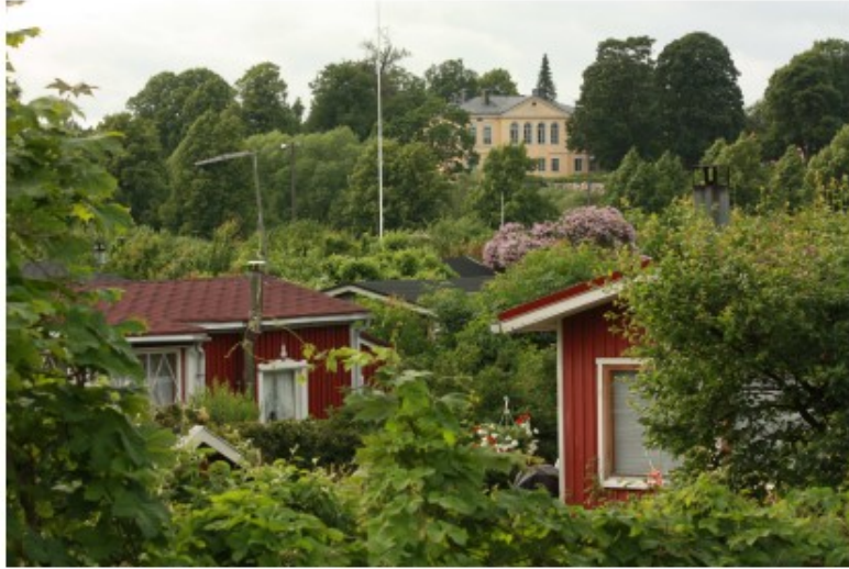
Kuva 11 Vallilan siirtolapuutarha, taustalla Kumpulan kartano