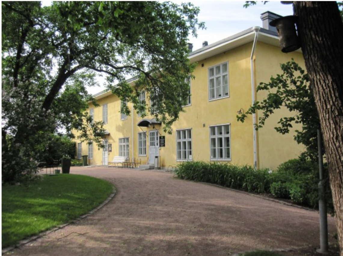
Kuva 5 Yläkartano

Päärakennuksen lisäksi 1800-luvun lukuisista talousrakennuksista on jäljellä enää neljä. Suurin niistä on kartanon entinen talli ja vaunuvaja, jota on kutsuttu yläkartanoksi. Rakennusta on käytetty myös kartanon kutomona, jossa on joskus ollut töissä 36 kutojaa. Sairaalan aikana talossa oli sairaushuoneita ja huoltotiloja. Rakennuksessa on nykyään kasvitieteellisen puutarhan toimisto- ja luentotiloja sekä tutkijahuoneita.