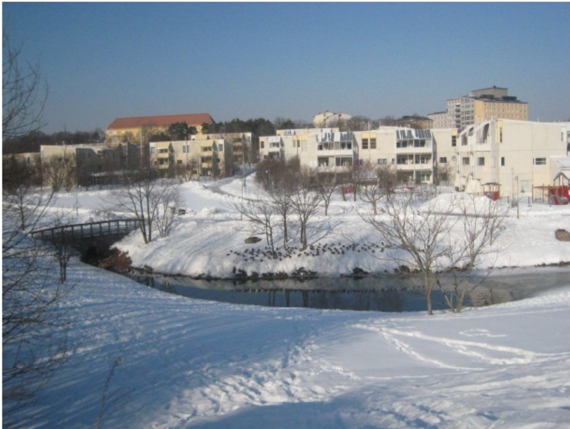
Kuva 10 Isoniityn asuntoaluetta – etualalla Kumpulanpuro

Alueen luoteisosaan, Kätilöopistoa vastapäätä rakennettiin 1980-luvulla Risto Jallinojan suunnittelema Isoniityn asuntoalue. Laaksoon kunnostettiin ulkoilutiet. Pihuille ja Kumpulantaipaleen varteen on istutettu useita lajeja Prunus -suvun puita.