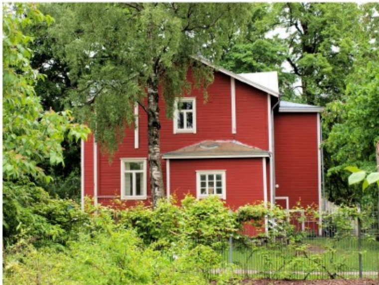
Kuva 12 Villa Novilla