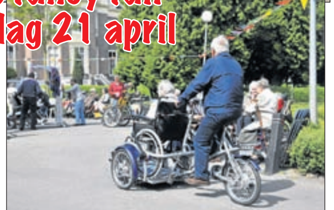
De rolstoeltransporter, aangeschaft met de opbrengst van vorig jaar.

Heemstede - Woensdagmiddag 21 april organiseert Verpleeghuis en Zorgcentrum Bosbeek in Heemstede een grote Fancy Fair. Op de rommelmarkt kunt u uitgebreid rondsnuffelen. Er is een grote boekenkraam, religieuze artikelen, kaarten, handwerk en een breed scala aan huishoudelijke spullen. Bij het rad van fortuin en de grote loterij zijn vele mooie prijzen te winnen. Ook aan de inwendige mens is gedacht: haring, poffertjes en koffie met taart zijn verkrijgbaar. De opbrengst is geheel voor het goede doel: een gedeelte wordt geschonken aan een kleinschalig project voor weeskinderen in Tanzania. Daarnaast wordt met de opbrengst een fitnessruimte voor senioren aangelegd