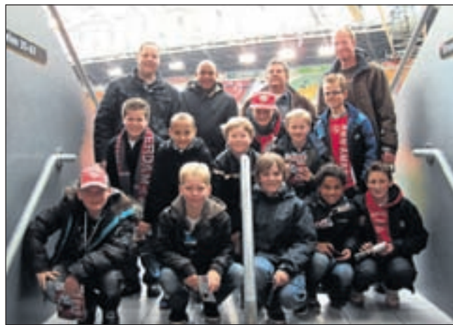
De jeugd van VEW.

Zaterdag 12 juni: BBQ voor de B-junioren, leiders en trainers.