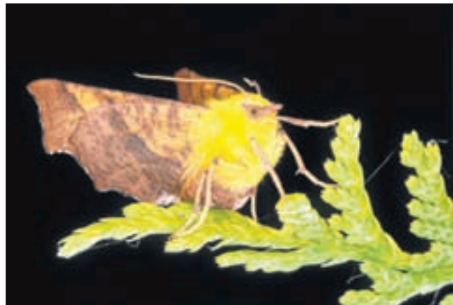
De hageheld is een nachtvlinder die u op Leyduin kunt 'ontmoeten'.