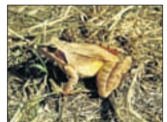
De bruine kikker komt alleen in de lente in het water voor de voortplanting.

Meer informatie op www.landschapnoordholland.nl . Alle buitenactiviteiten in Noord-Holland staan op www.natuurwagwijzer.nl