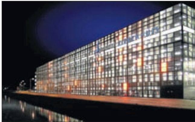
De parkeergarage zoals deze er uit zal zien na de verbouwing.

Het Spaarne Ziekenhuis vindt het belangrijk dat patiënten en bezoekers zo min mogelijk hinder van deze verbouwing ondervinden. Er zijn daarom tijdelijk extra parkeerplekken gerealiseerd op het parkeerterrein Zuid waar patiënten