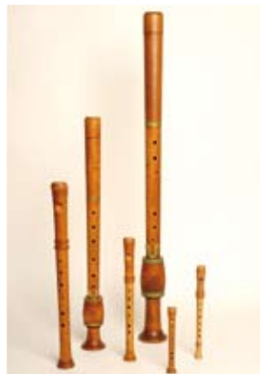
voorbeelden van snaar-, slag- en blaas- instrumenten