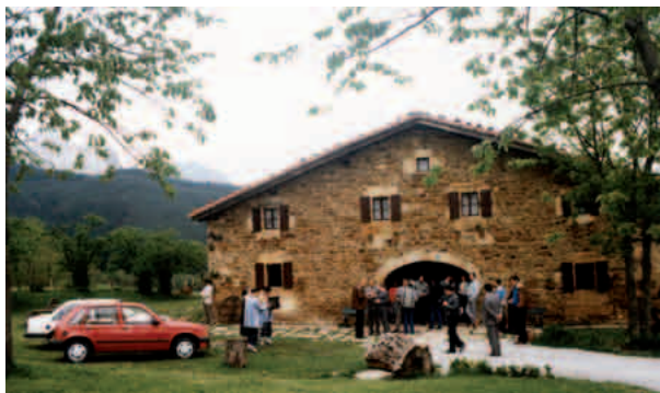
Mendigoikoa jatetxea, Axpe-Arrazolan