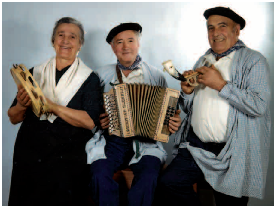
Garai bateko eredu