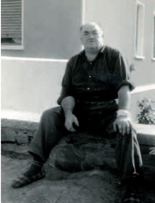
Benantzio, oraindik sasoi bete

ordu horietan bere burua eta barrenak lasaitzearren, puntu-puntu jartzearren, astiarekin ibiltzea.