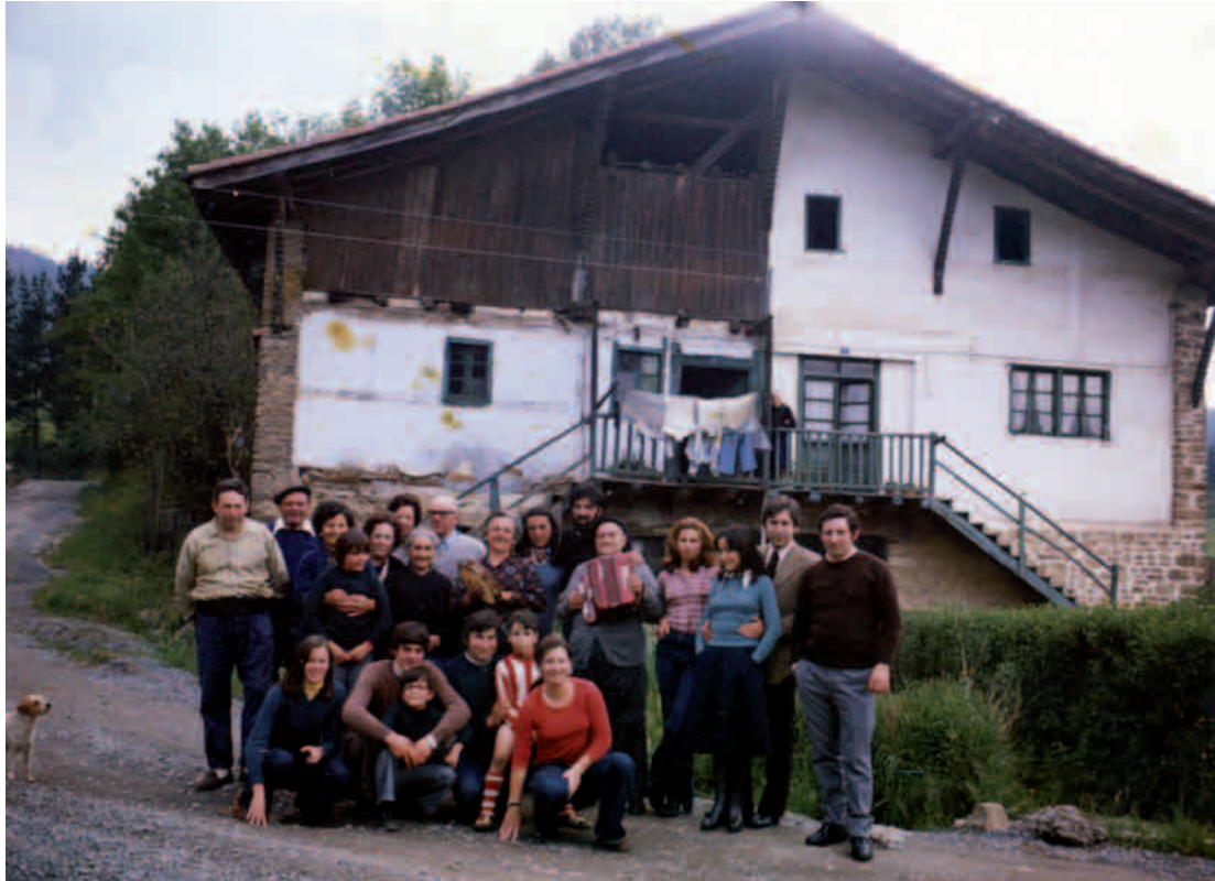
Argazkian bikotea Artea-Elixabetin, euren ezkon etxea izandakoaren aurrean, errentari eta auzokoekin

tatzen du maiatzeko San Isidrotan, bere amak inoren laguntza barik, hamalau gurdikada sats banatu zituela Dimara jotzera joan aurretik.