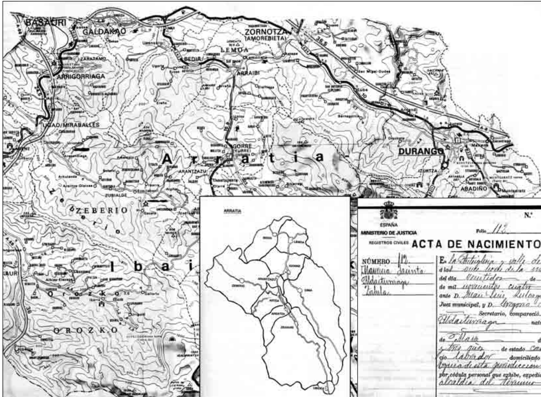
xx. mende hasierako Arratia eta inguruneko mapa