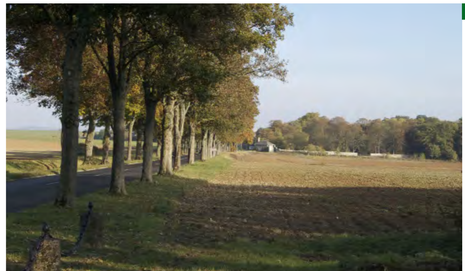
En haut à droite : les retenues d'eau En bas, à droite : D 330 entre Villemétrie et Mont-Levêque