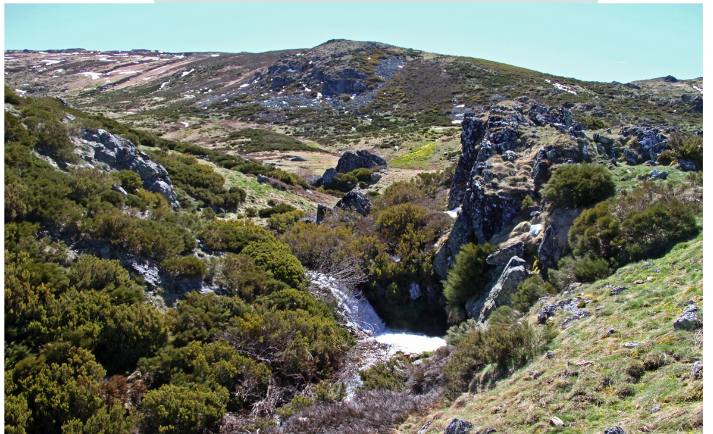
O Xares no Escavadoiro