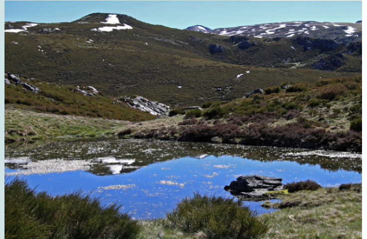
Lagoa no camiño ao Turrieiro