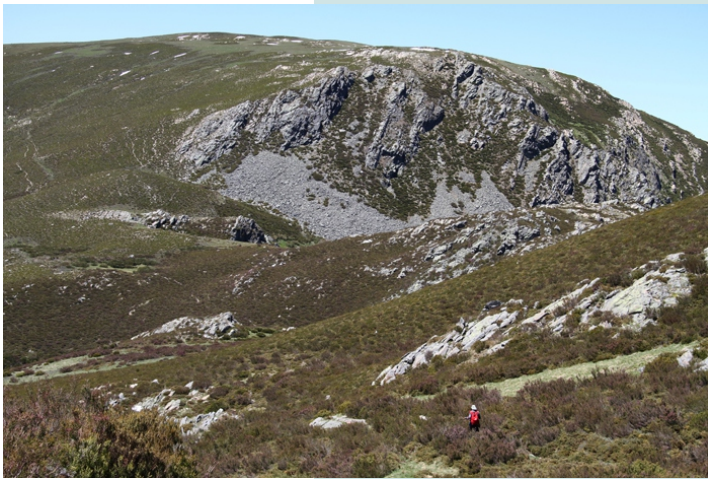
O Fial á volta da ruta