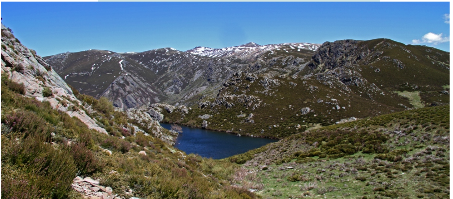
Vista da Lagoa da Serpe e Trevinca desde o Fial. No centro, debaixo de Trevinca vese o Escavadoiro