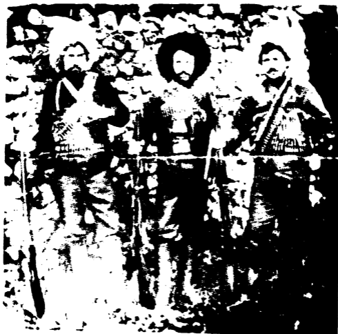
ԳՐՕ, ՄԱՏԹԷՈՍ, ՔԻԻՐՏ ԽԷԶՕ (1905ԻՆ)