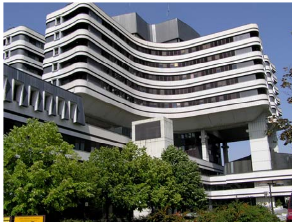
Sl. 4 – Zgrada Vojnomedicinske akademije na Banjici