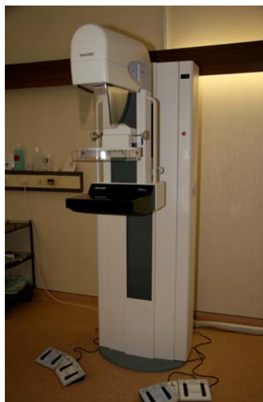
Sl. 9 – Digitalni mamograf

Ulaganje u znanje i novu opremu predstavlja jedan od proklamovanih strateških ciljeva VMA koji se, takođe, uspešno realizuje. Multislajzni skener najnovije generacije, egzajmer laser, digitalni mamograf, aparat za razbijanje kamena u bubregu, nova oprema u Klinici za anesteziologiju i intenzivnu terapiju, kao i u Institutu za transfuziologiju, samo su neke od novina u radu VMA (slika 9 i 10). Ovih dana završena je rekonstrukcija funkcionalne gastroenterologije koja