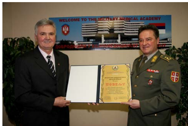
Sl. 6 – Uručenje povelje Udruženja vojnih penzionera Načelniku Vojnomedicinske akademije general-majoru, prof. dr Miodragu Jevtiću

vojnih penzionera 27. januara 2009. godine uručilo Načelniku VMA, kao najviše priznanje za izvanredan višegodišnji doprinos razvoju, unapređenju i afirmaciji njihove organizacije (slika 6).