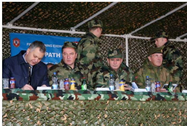
Sl. 8 – Najviši zvaničnici Ministarstva odbrane i Vojske Srbije posmatraju izvođenje međunarodne vojnosanitetske vežbe „Siguran put 08“

Nakon uspešno realizovane međunarodne vojnosanitetske vežbe „Siguran put 08“, održane na jugu Srbije, u kojoj su učešće uzeli pripadnici sanitetskih snaga Kraljevine Norveške i Makedonije, a koju je sve vreme nadgledalo više od 40 posmatrača iz osam zemalja sa tri kontinenta i svi vojno-diplomatski predstavnici akreditovani u našoj zemlji, srpski vojni sanitet dobio je međunarodni sertifikat kojim je potvrđena njegova osposobljenost za učešće u eventualnim međunarodnim mirovnim misijama, u skladu sa odlukama državnog rukovodstva (slika 8).