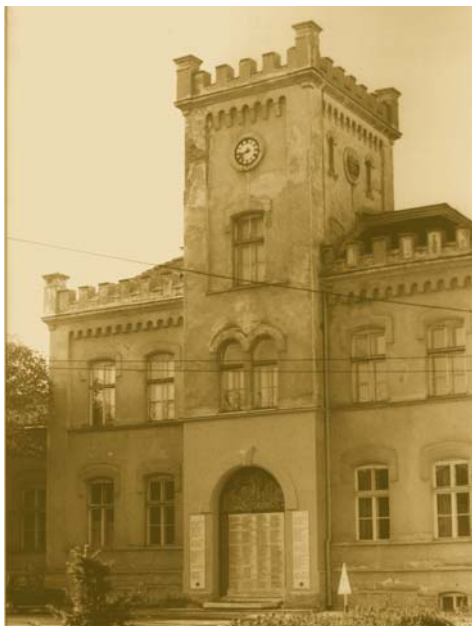
Sl. 2 – Upravna zgrada Vojnomedicinske akademije na Vračaru