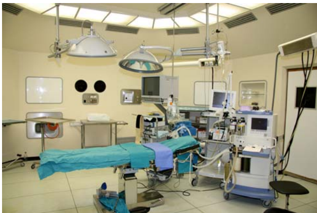
Sl. 5 – Savremeno opremljena hirurška sala u Vojnomedicinskoj akademiji

Tokom prošle godine u VMA ostvareni su izuzetni rezultati u svim oblastima medicine, a posebno u hirurgiji koja ostaje zaštitni znak ove ustanove (slika 5). I najsloženije operacije, poput transplantacije jetre, bubrega, matičnih ćelija izvode se rutinski u VMA. Za svoj rad na polju endovaskularnog zbrinjavanja aneurizmi abdominalne aorte tokom prošle godine VMA je dobila i međunarodni sertifikat.