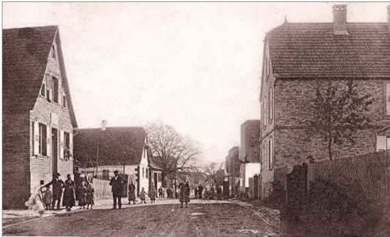
Bruss aus Forstheim i|E.