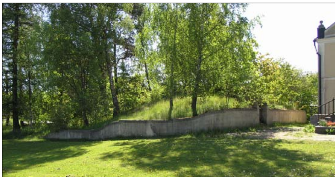
Murens södra del invid trädgårdsmästarbostaden, sedd från nordväst. Lp20080667