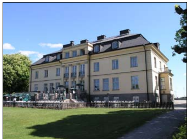
Huvudbyggnadens trädgårdssida från sydväst. Lp20080658