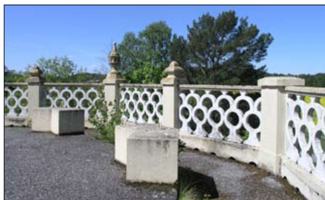
Vattentornets krön med gjuten balustrad och fundament, från öst. Lp20080672