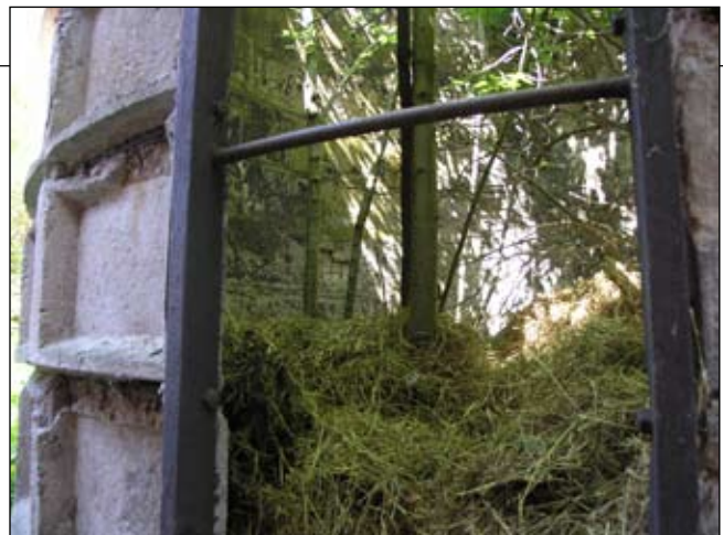
Detalj vid den vertikala öppningen. Lp20080705