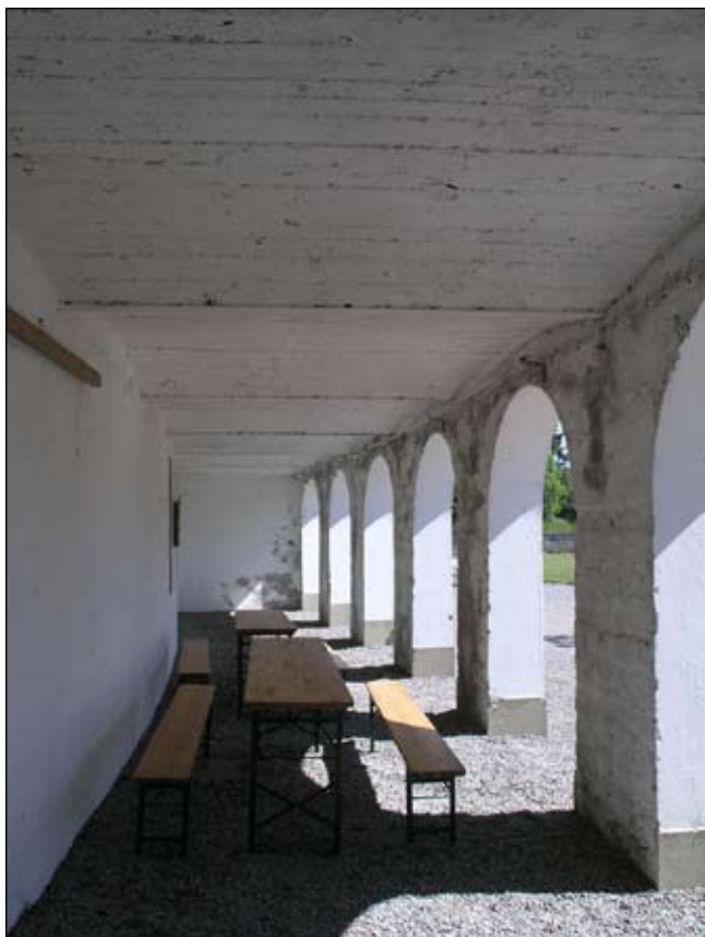
Östra arkaden sedd invändigt från väster. Lp20080714