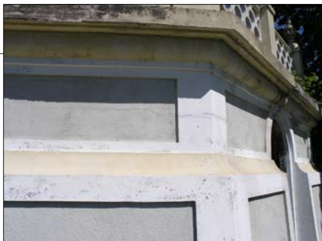
Detalj av södra fasadens ramverk. Lp20080671