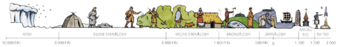
Tidsaxel: Mats Vänehem

© Stockholms läns museum Produktion: Stockholms läns museum Redaktionell bearbetning: Åsa Lundström