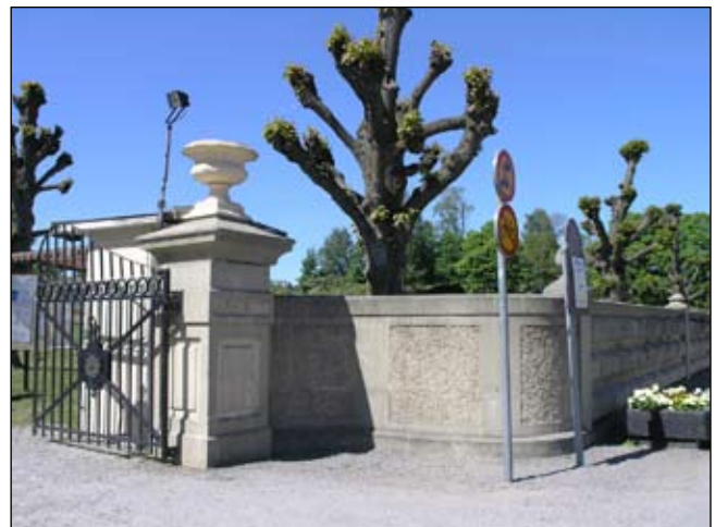
Huvudentré med pelare, grind från sydväst. Lp20080663