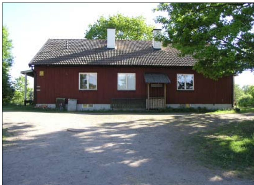
Arbetarbostaden sedd från nordöst. Lp20080711