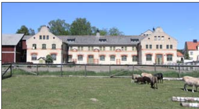
Ladugårdens södra fasad. Lp20080684