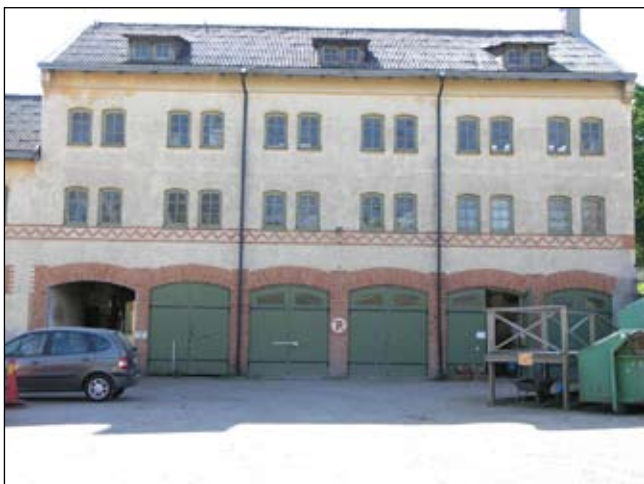
Magasinet's östra fasad. Lp20080687