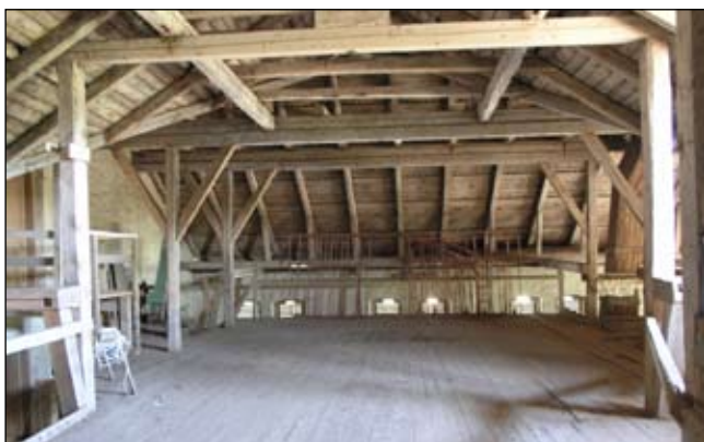
Ladugårdens höloftgång med vändzon för häst och vagn. Lp20080686