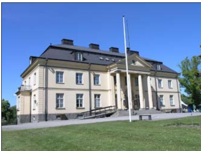
Huvudbyggnadens entrésida från sydöst. Lp20080657