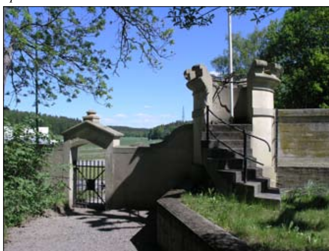
Sidoentré i murens nordliga del. Lp20080666