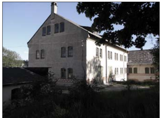
Magasinet sett från nordväst. Lp20080688