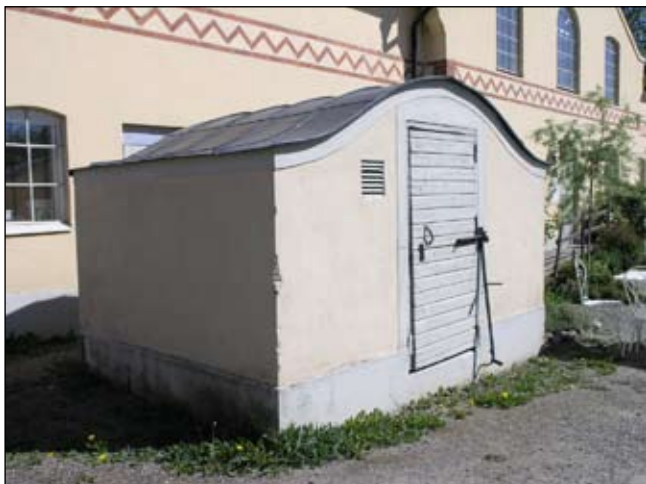
Litet hus från sydväst. Lp20080698