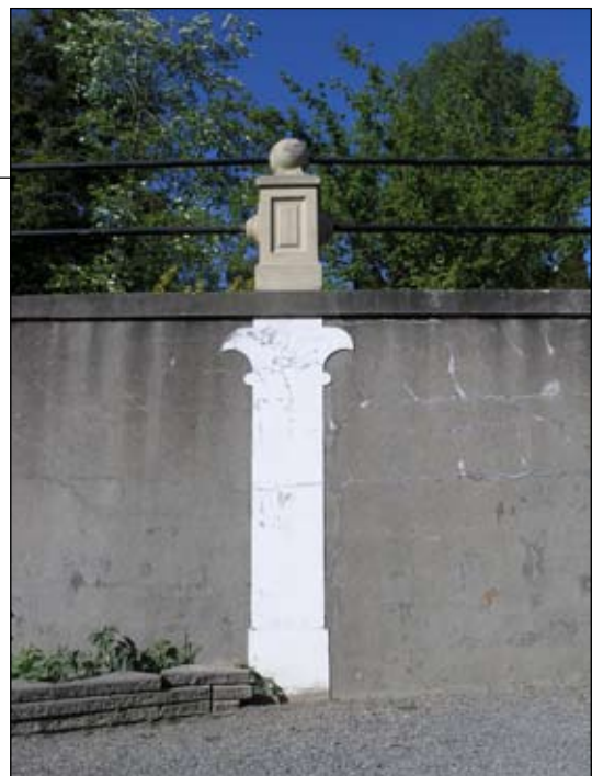
Detalj av putsdekor och balustrad, sedda från söder. Lp20080709