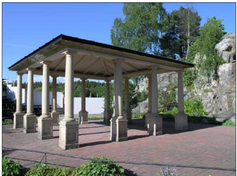
Torkplan i tempelstil sett från sydväst. Lp20080710

Nivå 2 – 3:10. En för parken miljöskapande stilromantisk byggnad i samklang med anläggningens helhet.