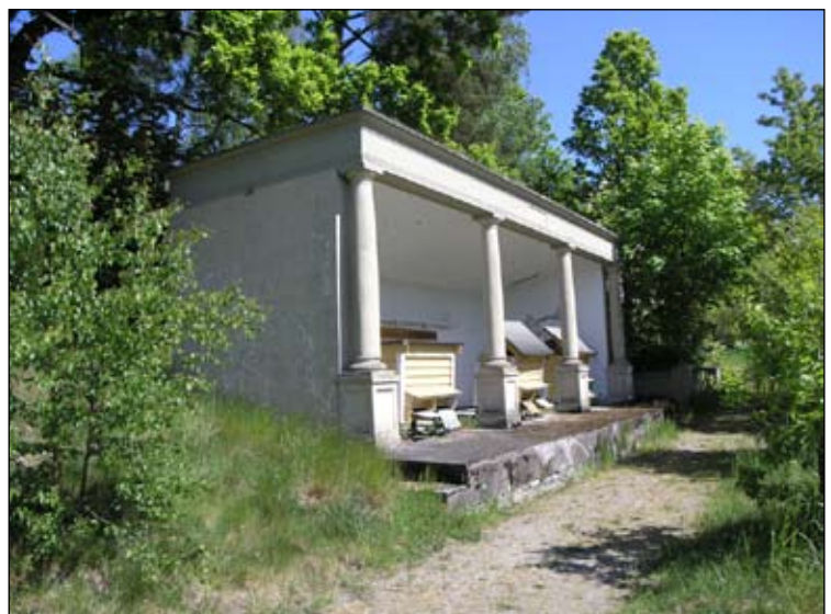
Bigården sedd från sydväst. Lp20080679