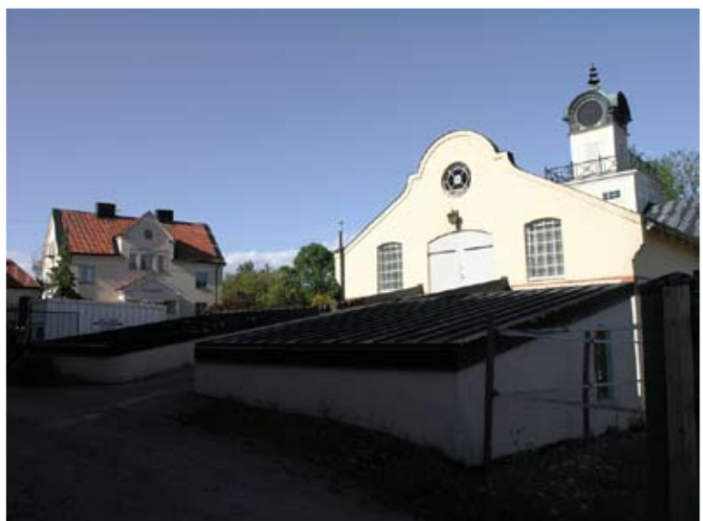
Klockhusets ramp med sidobyggnader sedda från sydväst. Lp20080692

Nivå 3 – En del av uppfarten till vagnslidrets vind.