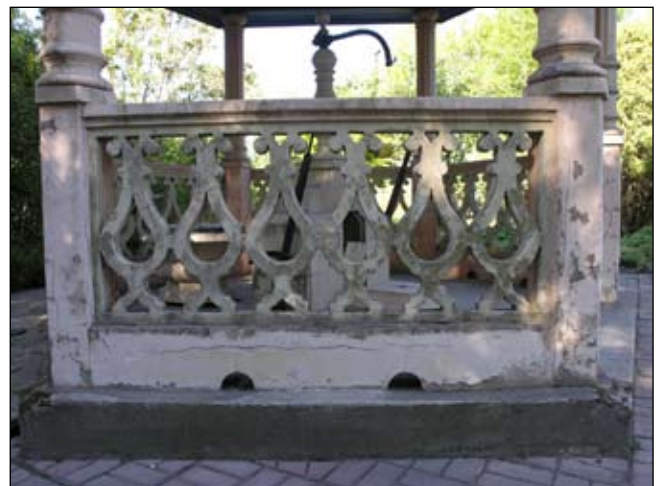
Detalj av balustrad i väster. Lp20080707