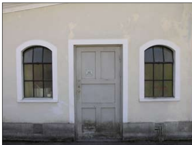
Trädörr och fönster med gjutjärnsspröjs, sett från norr. Lp20080678