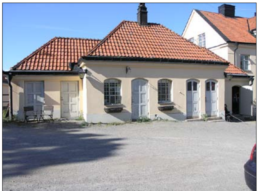
Uthusets fasad mot söder. Lp20080701