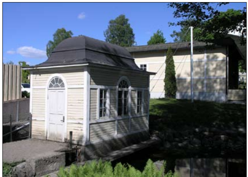
Lusthuset sett från sydväst. Lp20080694