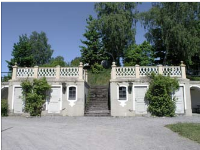
Orangeri från söder. Lp20080668

Inramar området norrut, en del av helhetens omgärdning tillsammans med murar mot öster(3) och söder(8). Nivå 2 - 3:10- Miljöskapande och en betydelsefull inramning av park och område.