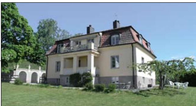
Lillgårdens trädgårdsfasad från sydväst. Lp20080659