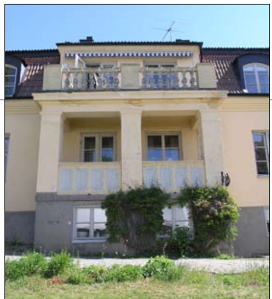
Trädgårdsfasadens veranda från väst. Lp20080661