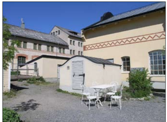
Litet hus från sydöst. Lp20080699