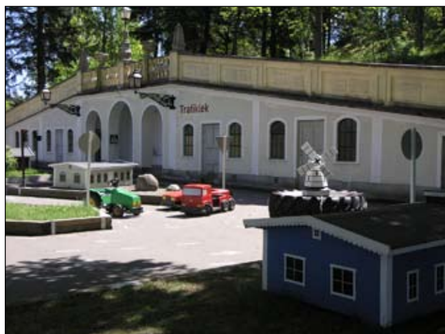
Rotfruktskällarens norra fasad med överliggande väg. Lp20080677