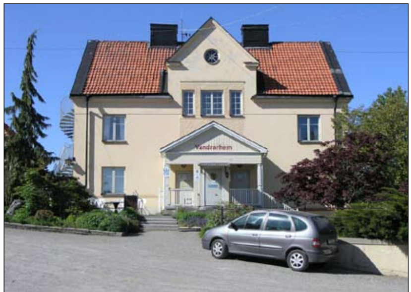
Vandrarhemmet sett från söder. Lp20080700