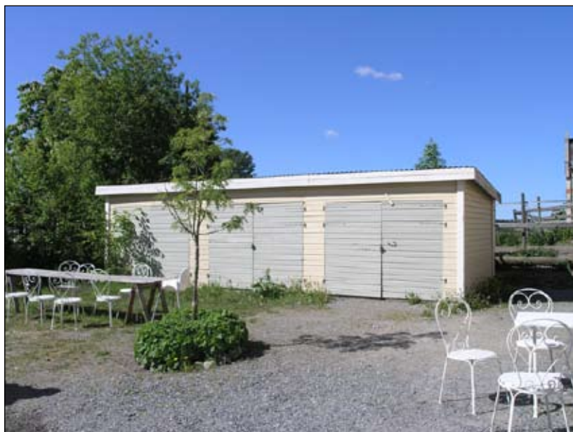
Garagelänga från väst. Lp20080697

Nivå 3- Miljöskapande på gårdsplanen i anslutning till fruktpackarhus och klockarhus.