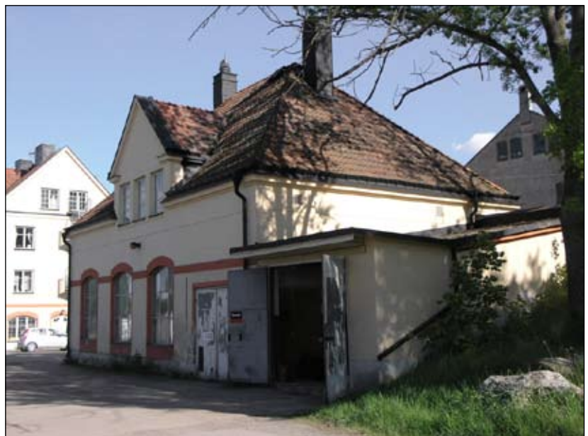
Kraftstationen sedd från nordväst. Lp20080702