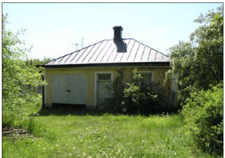
Uthuset sett från norr. Lp20080675