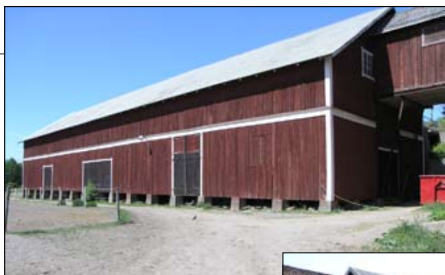
Logen sedd från sydöst. Lp20080681