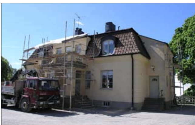
Lillgårdens entrésida från nordöst. Lp20080660