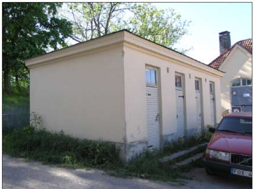
Utedasslänga sedd från sydöst. Lp20080703