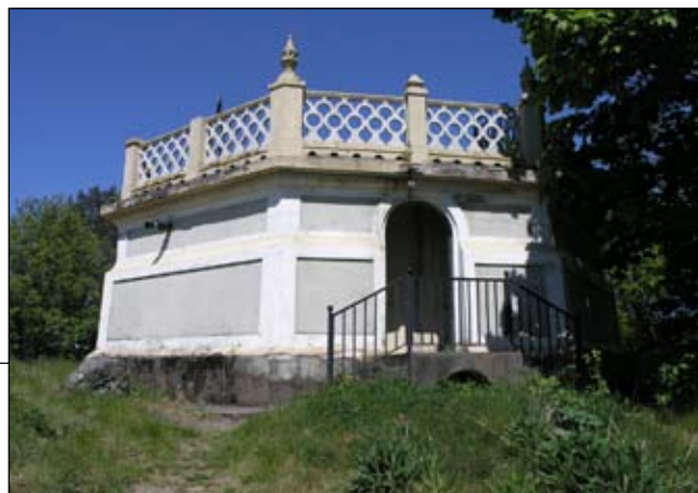
Vattentorn från söder. Lp20080670