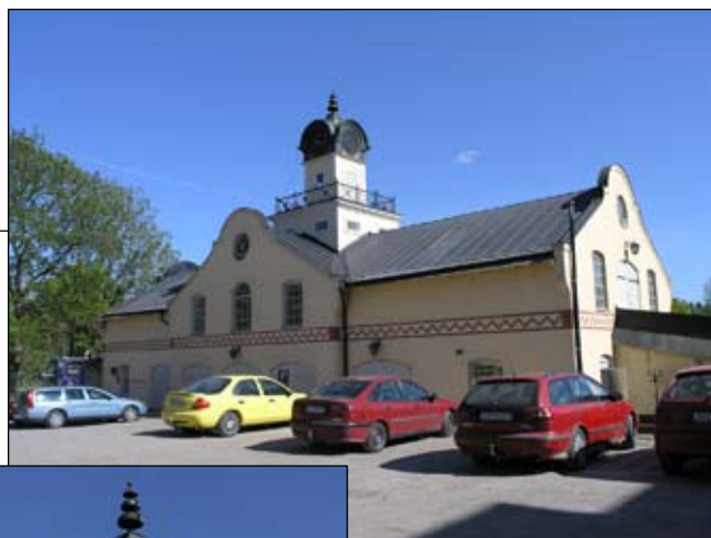
Vagnslider från nordväst. Lp20080690