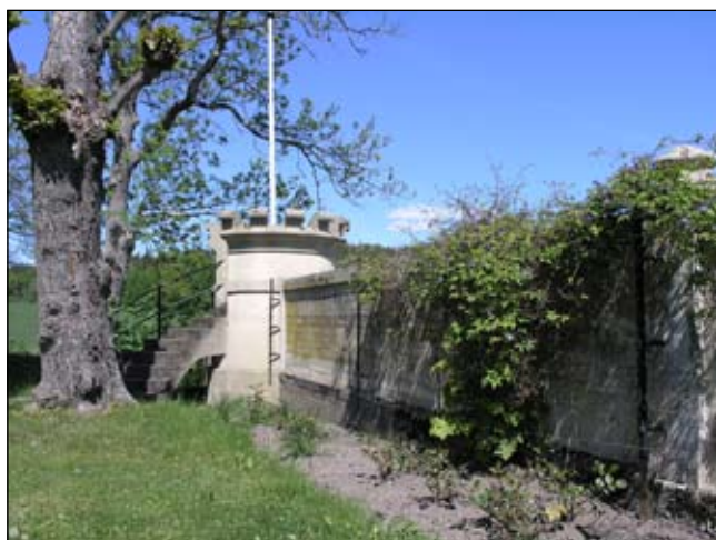
Medeltidsromantiskt hörntorn i murens nordliga del. Lp20080665