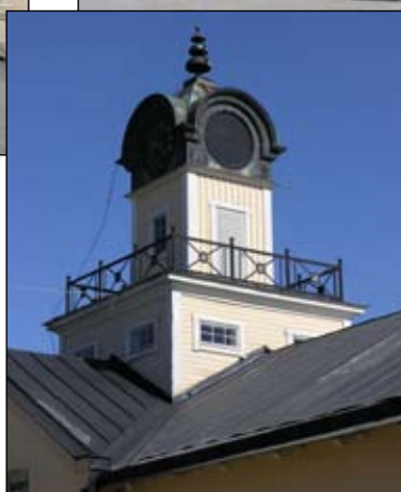
Klocktorn från nordväst. Lp20080691