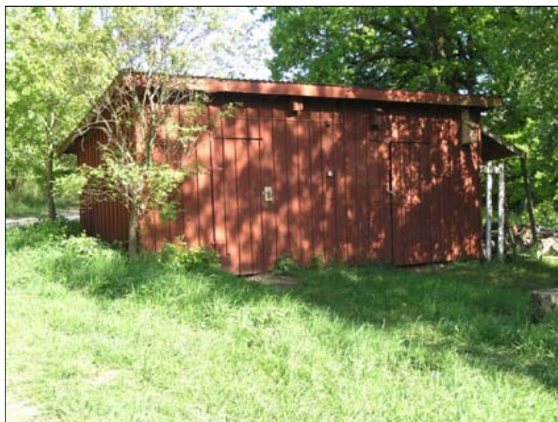
Uthuset sett från väster. Lp20080712