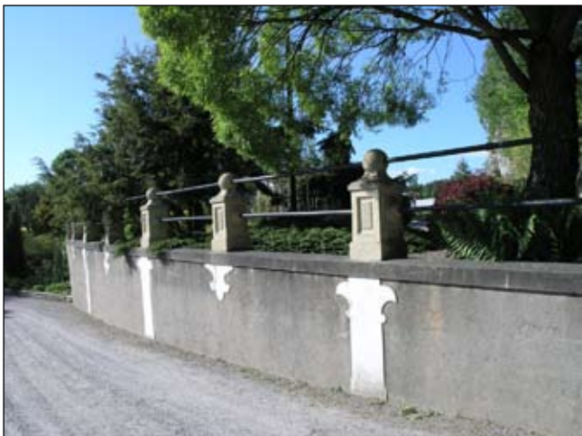
Stödmur sedd från sydöst. Lp20080708

Nivå 3 Inramning av miljön, med utformning som återkommer i områdets övriga murpartier.