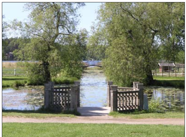
Betongbryggan sedd från öster. Lp20080680