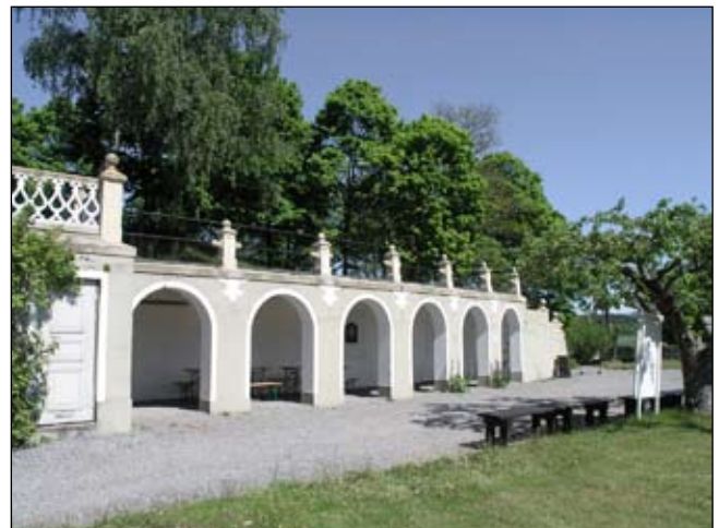
Arkad österut. Lp20080669