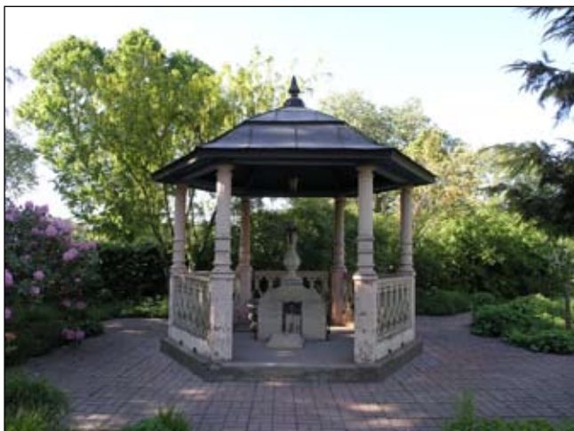
Brunnshus sett från söder. Lp20080706

Nivå 2 - 3:10 Ingår i den anlagda parkmiljön, med en ursprunglig funktion som brunnshus. Miljöskapande och typisk för den stilromantik som återspeglas i hela anläggningen.