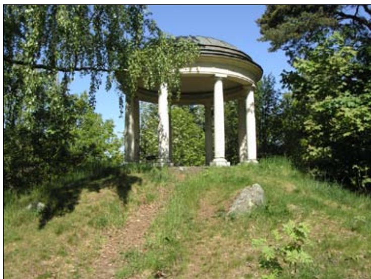
Ekotemplet sett från söder. Lp20080676