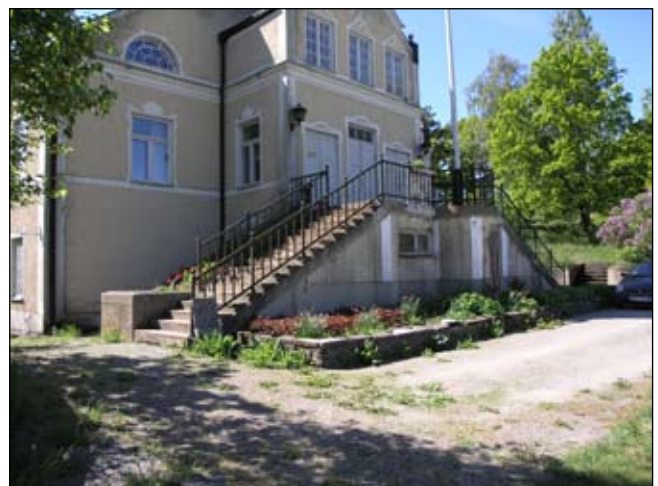
Trappan sedd från nordost. Lp20080674