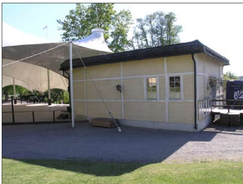
Friluftsscen från nordöst. Lp20080693