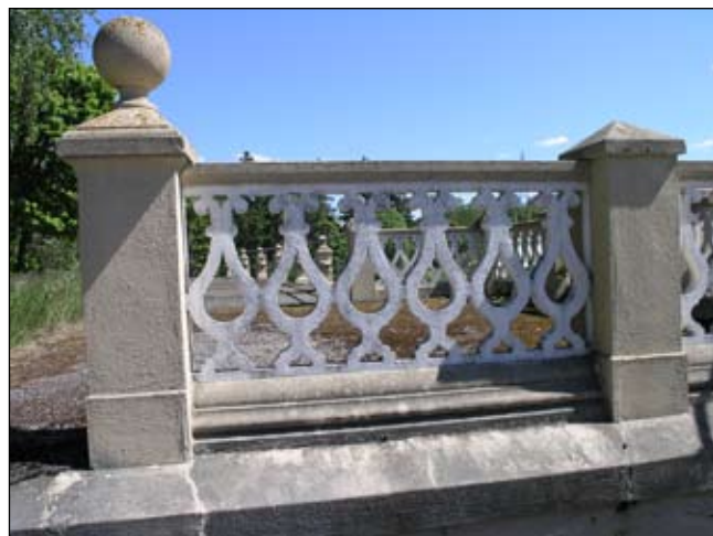
Detalj av balustraden, sedd i trappan från väster. Lp20080715