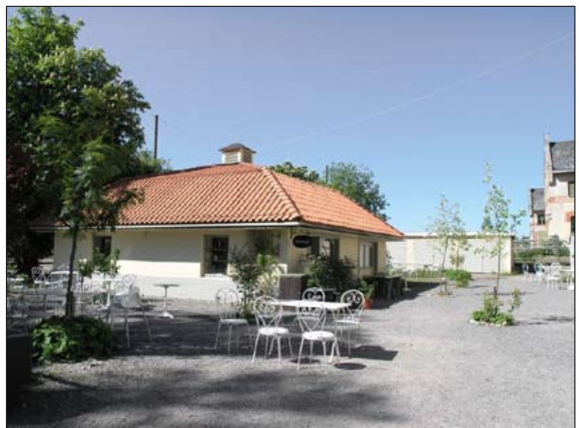
Fruktkällare från nordöst. Lp20080696

Nivå 3 – Viktig för närmiljön omkring vagnslidret. Fruktkällaren var beläget i närheten av vagnslidret och underlättade på så vis transportereringen av frukt från gården. Byggnaden är en rest från den tid då gården bedrev fruktodling.