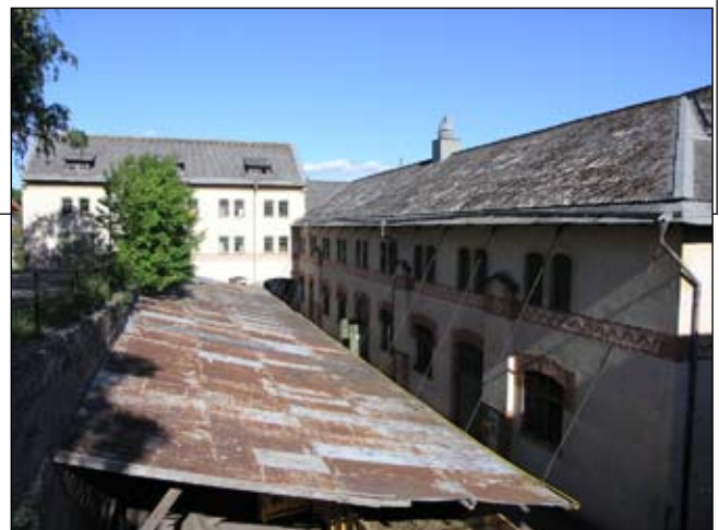
Ladugårdens norra fasad till höger i bild, sedd från nordväst. Lp20080685