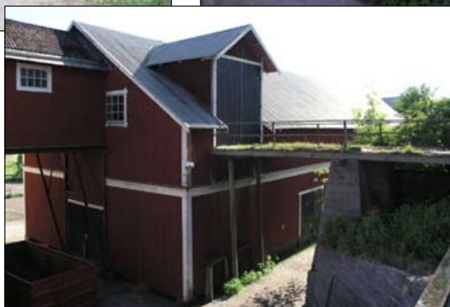
Logens norra fasad med bro till höloftgången. Lp20080682

↑ Inkörsel från stallbacken, bestående av bro samt betongfundament, sedd från sydöst. Lp20080683