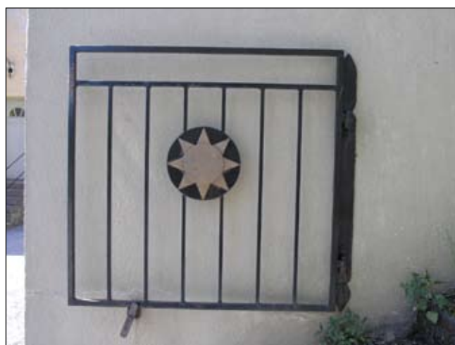
Trappans västra grind, med dekor i form av stjärna. Lp20080716