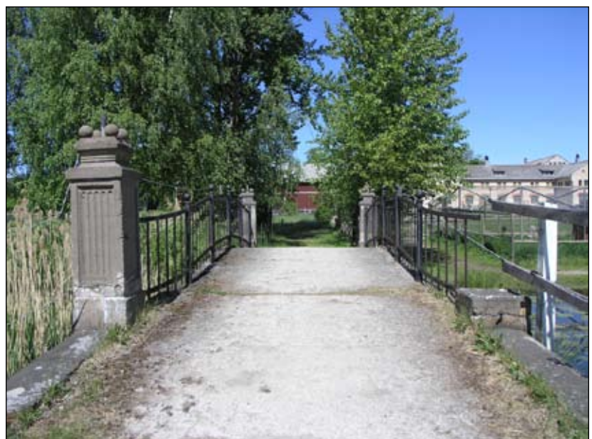
Betongbron sedd från söder. Lp20080713