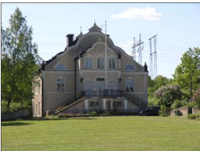
Trädgårdsmästarebostaden från nordost. Lp20080673