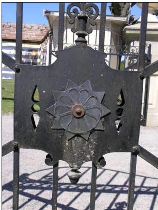
Detalj av entrégrindens delar; stjärnan är ett återkommande stilelement. Lp20080664