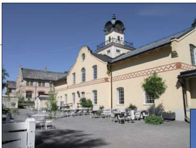
Vagnslider från sydöst. Lp20080689