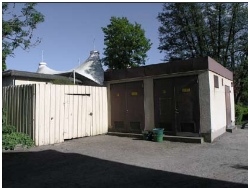
Elhuset från nordväst. Lp20080695