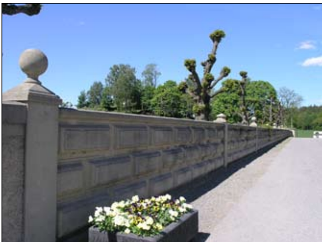
Entrémurens nordliga sträckning från sydöst. Lp20080662