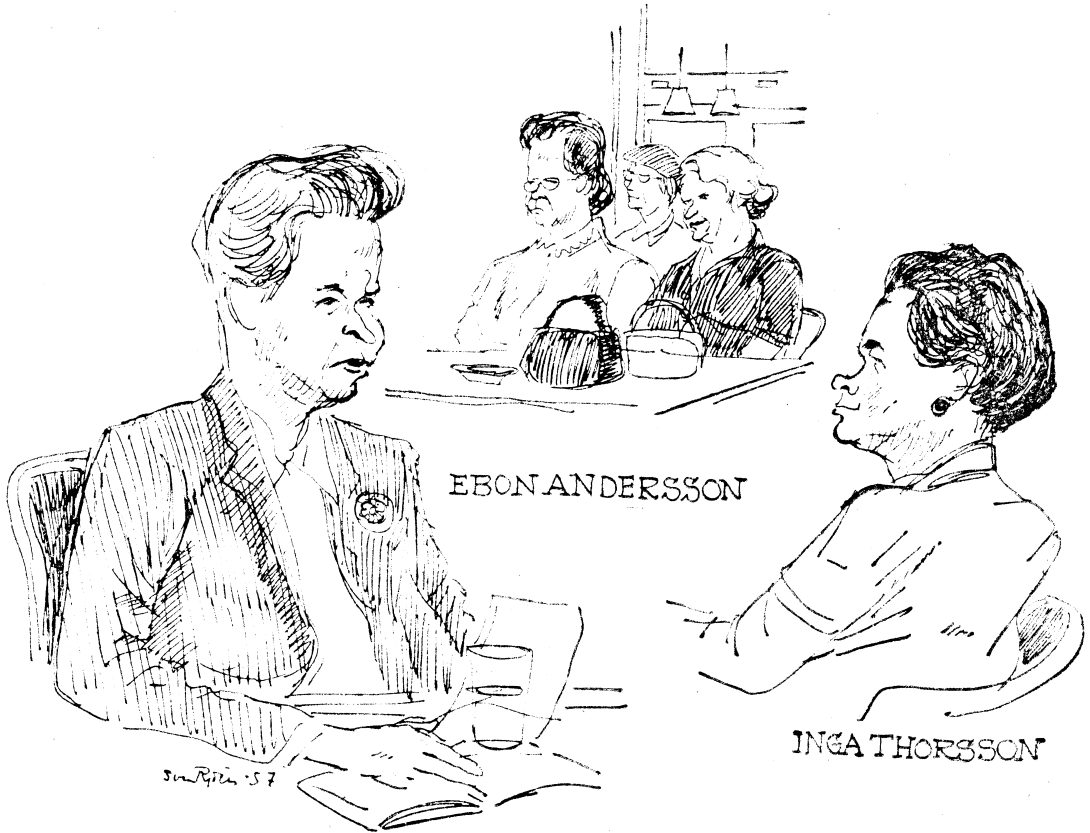
Kvinnobud om skatter. Debatten den 4/2 1957 tecknad av Sven Rydén.

blir generell utdelning av förmåner”. Samtidigt fick många inte den hjälp just de behövde. Den 9 november 1957 anordnade Högerns kvinnoförbund en stor debatt i riksdagen med många inkallade sakkunniga om socialpolitiken inför 1960-talet. Debatten refererades dagen därpå av SvD . Ebon Andersson inledde: