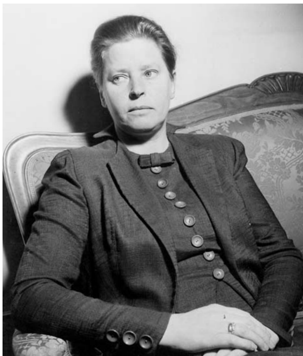
Ebon i sammanbindningsbanan omkring 1947.

Den 28 maj 1946 antogs det nya handlingsprogrammet. Talet om familjelön försvann och ersattes av att ”män och kvinnor böra erhålla lika lön för likvärdigt arbete”. Socialpolitiken skulle utgå från den enskildes självsansvar. Förordet för en mer generell socialpolitik blev restriktivare och försågs med ständiga hänvisningar till samhällsekonomin. Tryggheten skulle främst öka genom en förbättrad socialförsäkring, med avgifter som så långt möjligt svarade mot förmånerna.