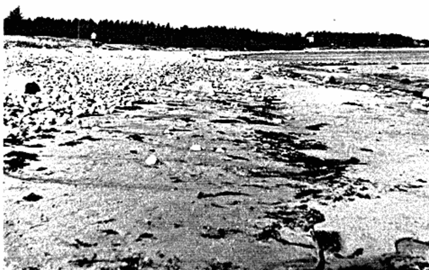
Fig. 6. Stranden i afsnit III. Efter en storm sidst i marts forsvandt alt sandet, så stranden blev til et sten-glacis helt fra klinten og ud i vandet. En ny sandrevle har nu lagt sig i vandkanten. 3. 4. 61, foto 4157.

Fig. 6. The beach in section III. After a gale late in March all the sand disappeared, leaving the beach as a stone glacis from the very cliff and out into the sea. Another sand bar has now been formed in the water edge. 3. 4. 61, photo 4157.