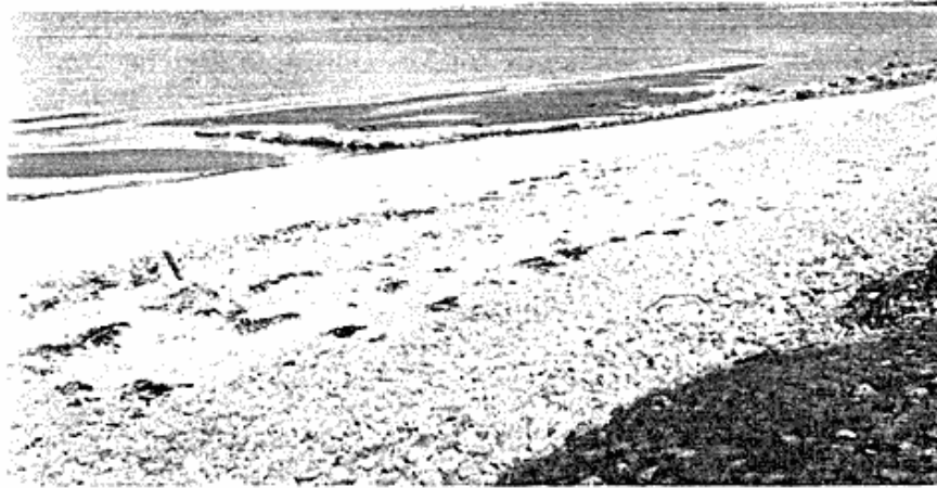
Fig. 14. Stranden i afsnit III med revler ude i vandet og en sandrevle inde på stranden. Længere inde mod klinten er stranden mere og mere stenet. 30. 3. 68, foto 4413.

Fig. 14. The beach in section III with bars in the water and a sand bar on the beach. Nearer the cliff, the beach is getting more and more stony. 30. 3. 68, photo 4413.