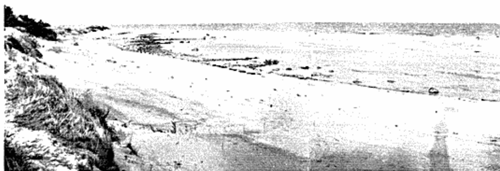
Fig. 8. Vestenden af afsnit IV. I baggrunden ses roden af den afspærrende revle med retning mod Hornbæk, inden for den ses et lavvandet felt med sandbund. Nærmest pynten i baggrunden (punkt IV/V) består havbunden af sten, men på land er der sandstrand. 22. 11. 62, foto 4220-21.

Fig. 8. The western end of section IV. In the background the basis of the separating bar with direction towards Hornbæk. Inside it, a shallow zone with sand bottom. Nearest the promontory in the background (point IV/V), the sea floor consists of stones, whereas there is a sand beach on land. 22. 11. 62. photo 4220-21.