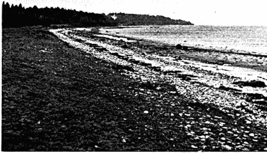
Fig. 3. Stranden i afsnit III og IV. Den gamle littorinaflade afsluttes udadtil af en lav klint. Neden for denne ses et konstant bælte af sten. Dette bælte bliver mere sandblandet udadtil. Helt ude ved vandet ses en sandrevle. 18. 10. 59, foto 4104.

Fig. 3. The beach in section III and IV. The old littorina flat ends in a low cliff facing the sea. Below it, there is a constant zone of stones which outwards is getting more and more mixed up with sand. At the water edge a sand bar. 18. 10. 59, photo 4104.