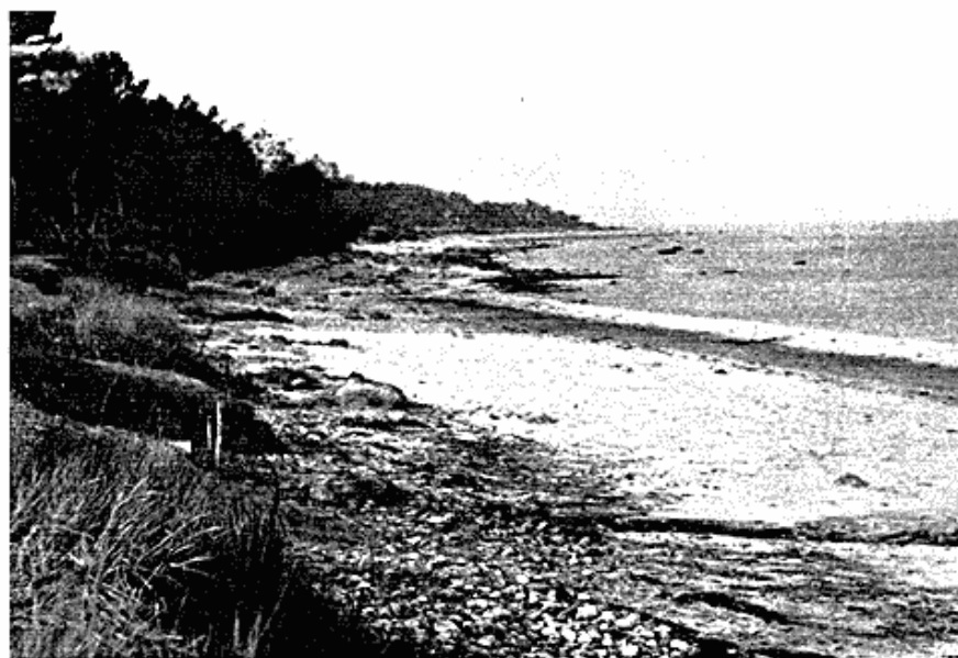
Fig. 4. Den østlige del af afsnit IV. Stenbæltet neden for klinten er ganske smalt, og foran det er der sandstrand i dennes fulde bredde. 16. 10. 59, foto 4113.

Fig. 4. The eastern part of section IV. The stone zone below the cliff is quite narrow and in front of it the whole beach is sand-covered. 16. 10. 59, photo 4113.