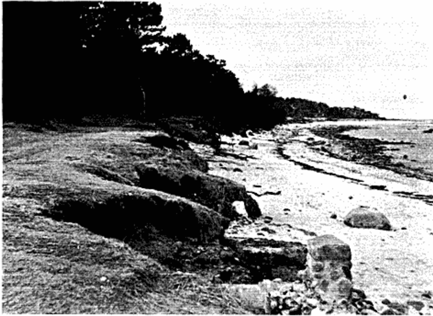
Fig. 7. Stærke storme i vinteren 1961-62 har angrebet kysten, og denne er rykket så meget tilbage, at munden af afløbet fra bebyggelsen ved Kildekrog er kommet til at stå 2 m foran klinten. 20. 2. 62, foto 4214.

Fig. 7. Strong gales in the winter 1961-62 have attacked the coast, which has retreated so much that the outlet from the houses at Kildekrog is visible 2 m in front of the cliff. 20. 2. 62, photo 4214.