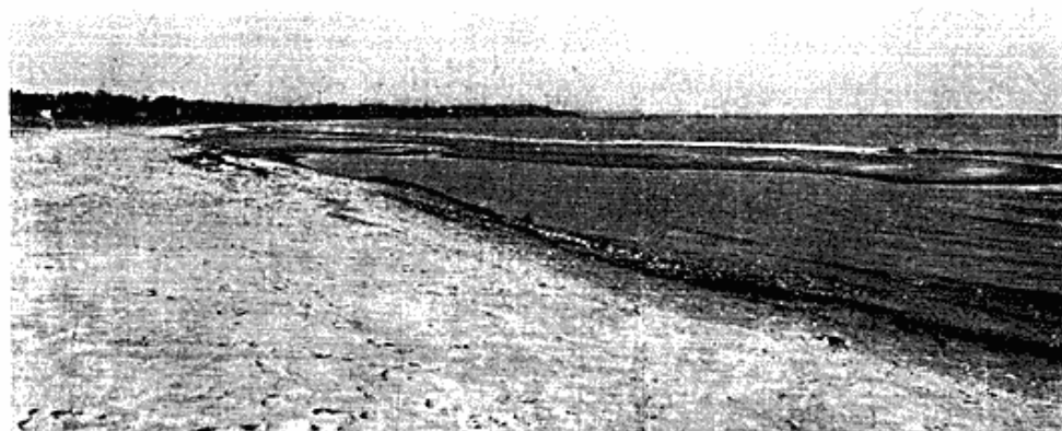
Fig. 13. Hornbækbugtens afsnit I med revler, der går skråt ud fra kysten med retning mod øst. 8. 4. 67, foto 4380-81.

Fig. 13. Section I with bars pointing obliquely towards the east. 8. 4. 67, photo 4380-81.