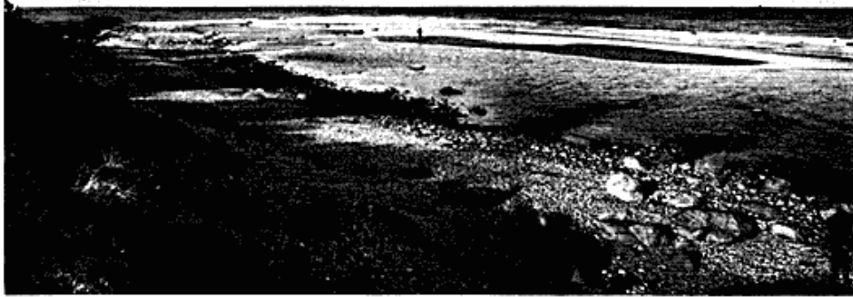
Fig. 11. Vestenden af afsnit IV. Inden for den afspærrende revle, der markeres af broddet, har der dannet sig en ny revle, der efterhånden vandrer ind på land. 7. 11. 65, foto 4253-54.

Fig. 11. The west end of section IV. Inside the separating bar, marked by the surf, a new bar has formed which gradually migrates onshore. 7. 11. 65, photo 4353-54.