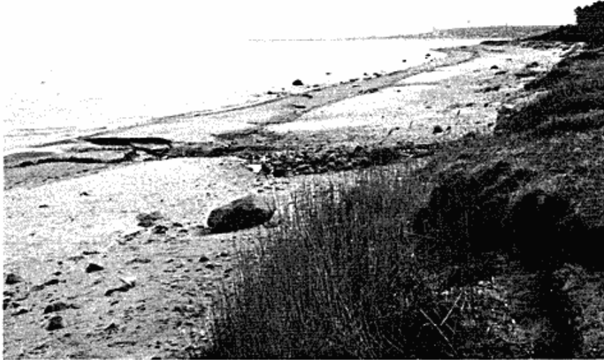
Fig. 12. Stranden i afsnit III. Yderst mod havet ligger en sandrevle. Inden for den bliver stranden efterhånden mere og mere stenet, jo nærmere man kommer til klinten. I forgrunden afløbet fra Kildekrog. Sandrevlen fortsætter hele vejen gennem afsnit III, II og I til Hornbæk. 7. 5. 66, foto 4364.

Fig. 12. The beach in section III. Outermost towards the sea there is a sand bar. Within it, the beach is getting more and more stony towards the cliff. In the foreground the outlet from Kildekrog. The sand bar continues the whole way through section III, II and I to Hornbæk. 7. 5. 66, photo 4364.