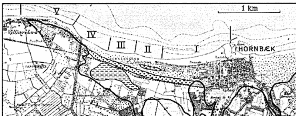
Fig. 2. Kort visende kysten af Hornbækbugten og dens bagland. Den stærkt optrukne linie viser den gamle postglaciale kystlinie. Det prikkede areal den øverste strandvold, på hvilken nu strandvejen ligger. Den vandrette skravering viser den tidligere strandlagunes udbredelse.

Fig. 2. Map showing the shoreline of the bay Hornbækbugten and its hinterland. The black line shows the old postglacial shoreline. The dotted area is the uppermost beach ridge on which the coast road runs today. The horizontal hatching shows the extension of the former beach lagoon.