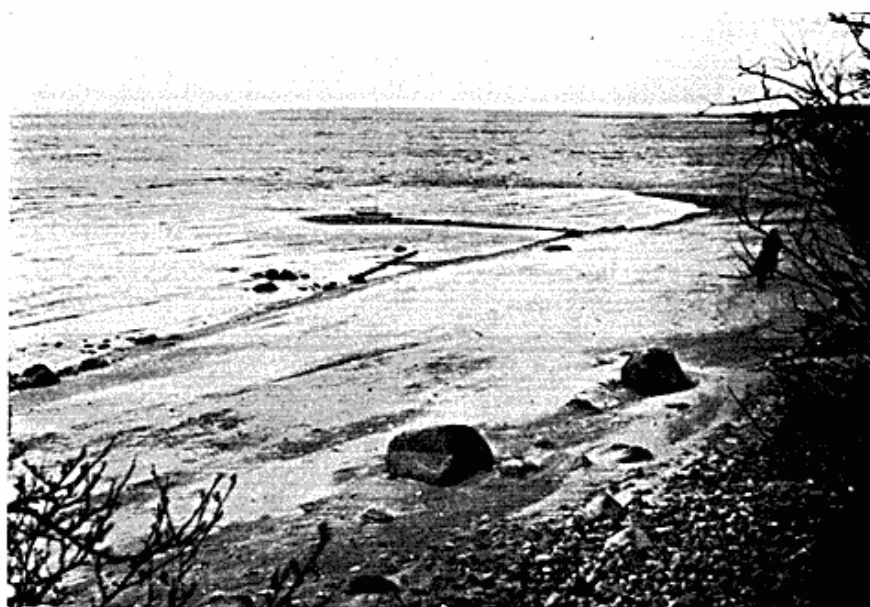
Fig. 9. Tombolodannelse v. f. Kildekrog. 8. 5. 65, foto 4249.