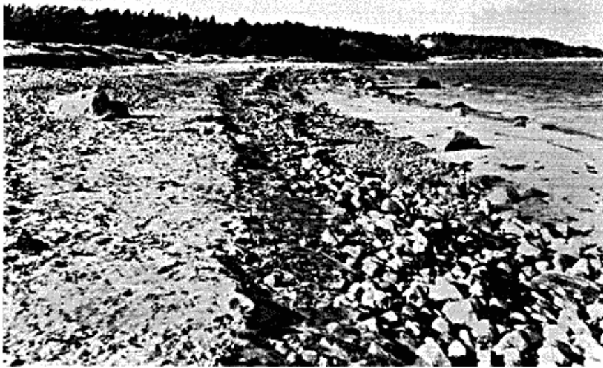
Fig. 5. Stranden i afsnit III. Havet har angrebet stranden og eroderet et hak i forkanten af den blanding af sand og sten, der danner den. Stenene er blevet liggende lige inden for hakket. 15. 10. 60, foto 4139.

Fig. 5. The beach in section III. The sea has attacked the beach and eroded a notch in the front edge consisting of a mixture of sand and stones. The stones remain lying just below the notch. 15. 10. 60, photo 4139.