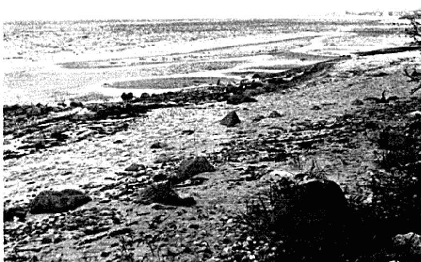
Fig. 10. Flade sandrevler danner et flak tæt inde under land i afsnit III og IV. 11. 9. 65, foto 4343.

Fig. 10. Flat sand bars constitute a flat very close to the shore in section III and IV. 11. 9. 65, photo 4343.