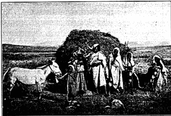
Indfødte foran deres Straa-Gourbi i Nord-Tunis.

I Medjerda Bjærgene i Nærheden af Duvivier saa jeg en Mand og en Kvinde i Færd med at bygge en gourbi. Stellet var omtrent rejst færdigt. Med en indbyrdes Afstand af 5—6 Skridt var rejst to foroven kløftede Stænger eller temmelig tynde Træstammer, der foroven bar en vandret Mønningstok. Væggene bestod af armtykke nedrammede Pæle, der ligesom Stammerne var ganske ubearbejdede, og endelig dannedes Tagets Skelet af Stokke, der som Sparrer var ophængte til begge Sider fra Mønningstokken nedtil Langsvæggene. Taget dannes ved en Belægning med Grene og Straa;