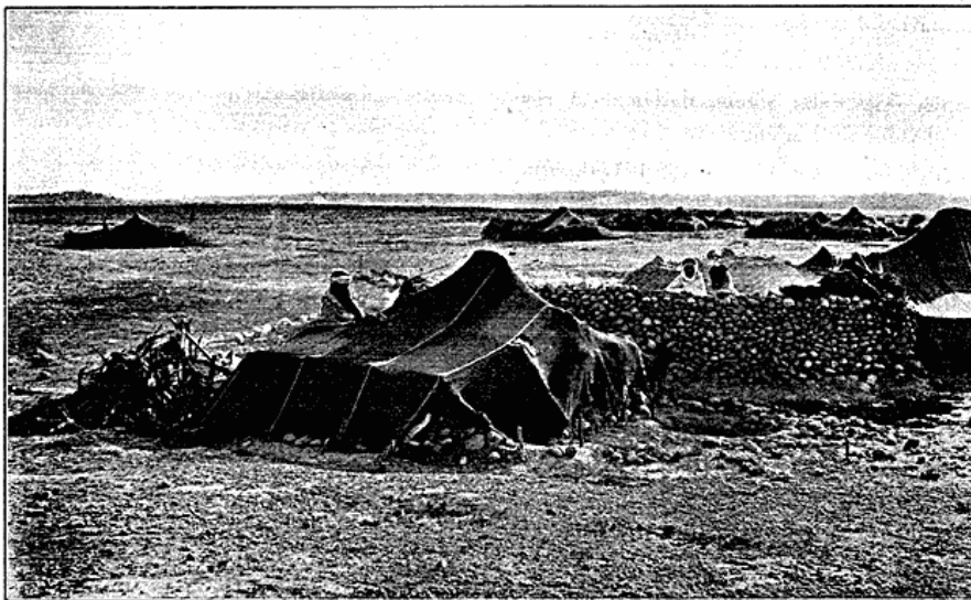
Faste Teltbeboere udenfor en Oase i Syd-Algier.

Videre gaar det op i Kabylernes Bjærg, langs de maleriske „gorges de Palestro“ og forbi Nybyggerlandsbyen Palestro, hvis Indbyggere 1871 nedsabledes af Kabylerne. Mod Nord ses Djurdjura-Kæden, der i Foraartiden endnu dækkes af mægtige skinnende hvide Snemasser, og foran Bjærgene ligger Kabylerslandsbyerne og kroner Højenes Toppe. Bebyggelsen er dog her temmelig svag og kan ikke i Tæthed og Ejendommelighed maale sig med den paa Djurdjura's Nordside. Ved Bouïra traf jeg en, Teltlejr af den almindelige arabiske