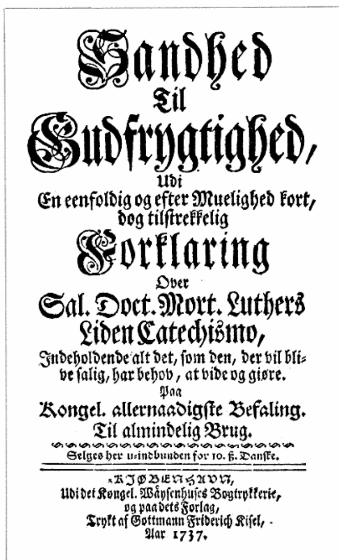
Titelblad til førsteudg. af Pontoppidans Forklaring til Luthers Katekismus. Hel st.