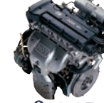
Beta-2.0D 141ps/6,000rpm / 18.8kg.m/4,500rpm / 1,975cc