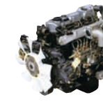
D4AF 96ps/3,400rpm / 24kg.m/2,000rpm / 3,568cc