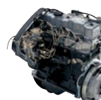
D4BF (T/C) 83ps/4,200rpm / 20kg.m/2,000rpm / 2,476cc