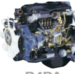
D4DA 155ps/3,200rpm / 38kg.m/1,800rpm / 3,907cc