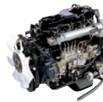
D4AL 120ps/3,400rpm / 30kg.m/2,000rpm / 3,298cc