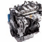
D-2.0 -CRDi 125ps/4,000rpm / 29kg.m/2,000rpm / 1,991cc