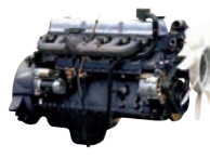
D6BR 131ps/2,000rpm / 50kg.m/1,600rpm / 7,545cc