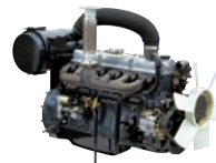
D6BR 130ps/1,800rpm / 7,545cc