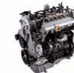
U-1.5 -CRDi 102ps/4,000rpm / 24kg.m/2,000rpm / 1,493cc