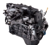
G4EB 78ps/5,500rpm / 11.9kg.m/3,500rpm / 1,495cc