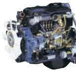
D4DA 98ps/2,300rpm / 33kg.m/1,700rpm / 3,907cc