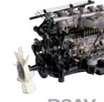
D6AV 235ps/2,200rpm / 78kg.m/1,400rpm / 11,149cc