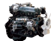
D4AK 80ps/2,400rpm / 25.5kg.m/1,800rpm / 3,298cc