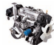
D4BB-T/C 60ps/1,800rpm / 24kg.m/1,500rpm / 2,607cc