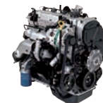
A-2.5 -CRDi 140ps/3,800rpm / 32kg.m/2,000rpm / 2,497cc