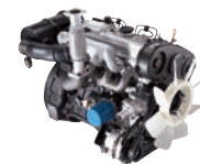
D4BB-50Hz 26ps/1,800rpm / 60kg.m/3,000rpm / 2,607cc