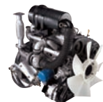
D4BB-T/C 64ps/2,500rpm / 19.9kg.m/2,000rpm / 2,607cc