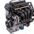
Gamma-1.6D 124ps/6,200rpm / 15.8kg.m/4,000rpm / 1,591cc