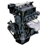
E-1.0 60ps/6,000rpm / 8.7kg.m/4,000rpm / 999cc