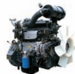
D4DA 107ps/1,800rpm / 3,907cc