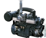
D6BT 180ps/1,800rpm / 7,545cc