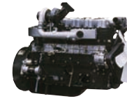
D6AC 310ps/2,100rpm / 137kg.m/1,400rpm / 11,149cc