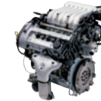
Sigma-2.5D 165ps/6,000rpm / 23kg.m/4,000rpm / 2,493cc