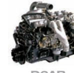
D6AB 310ps/2,200rpm / 125kg.m/1,400rpm / 11,149cc