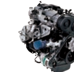
D4BH (T/Ci) 100ps/3,800rpm / 23kg.m/2,000rpm / 2,476cc