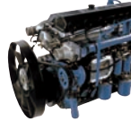
D6CA(EURO-II) 440ps/1,800rpm / 197kg.m/1,400rpm / 12,920cc