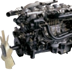
D6AC 340ps/2,200rpm / 140kg.m/1,400rpm / 11,149cc