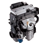
A-1.6D 112ps/6,000rpm / 14.8kg.m/4,500rpm / 1,599cc