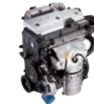
A-1.4D 97ps/6,000rpm / 12.8kg.m/4,700rpm / 1,399cc