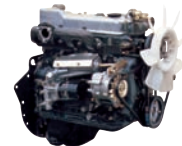
D4AF 63ps/2,400rpm / 19.6kg.m/1,600rpm / 3,568cc