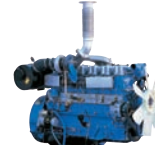
D6AZ-G1 309ps/1,800rpm / 11,149cc