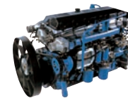
D6CA 430ps/2,000rpm / 195kg.m/1,400rpm / 12,920cc