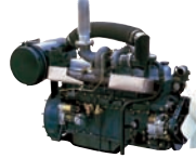
D6BT 160ps/2,000rpm / 54.7kg.m/1,600rpm / 7,545cc