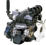
D4AK 82ps/1,800rpm / 3,298cc