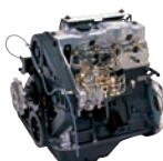
D4BB (NA) 80ps/4,000rpm / 17kg.m/2,200rpm / 2,607cc