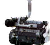
D6AC 350ps/1,800rpm / 11,149cc