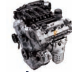
Lambda-3.3D 233ps/6,000rpm / 31kg.m/3,500rpm / 3,342cc