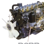
D6BR 177ps/2,900rpm / 49kg.m/1,400rpm / 7,545cc