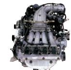
Omega-4.5D 270ps/5,500rpm / 38kg.m/4,500rpm / 4,498cc