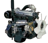
D4AF 60ps/1,800rpm / 3,568cc