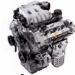
Lambda-3.8D 261ps/6,000rpm / 35.5kg.m/4,500rpm / 3,778cc