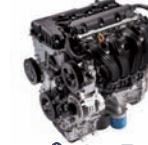
Theta-2.4D 160ps/6,000rpm / 22.3kg.m/4,250rpm / 2,359cc