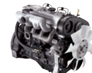
D4BB(BAC) 40ps/2,000rpm / 15kg.m/1,500rpm / 2,607cc