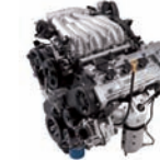
Mu-2.7D 191ps/6,000rpm / 25.5kg.m/4,000rpm / 2,656cc