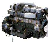
D6AZ 230ps/1,900rpm / 94kg.m/1,200rpm / 11,149cc