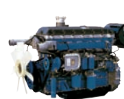
D6CA-G1 490ps/1,800rpm / 12,920cc