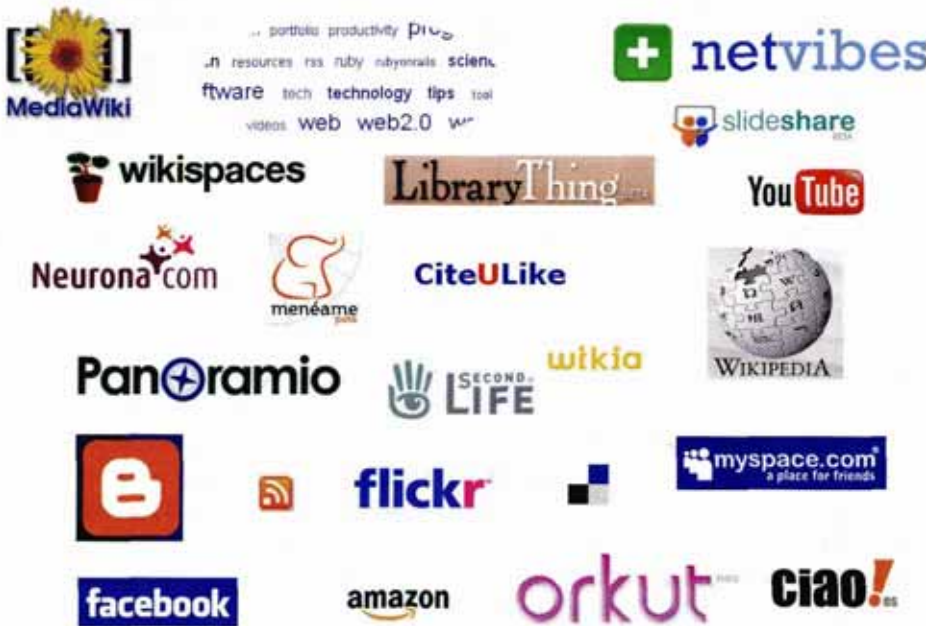
Algunos logos de la web social

Comencemos viendo los servicios de la web social con los blogs , que son los más populares de todos ellos, hasta el punto de que en ocasiones se establece una identificación entre ambos. Los blogs son sitios web con una estructura determinada, a modo de diario, en los que las personas o entidades responsables del mismo ponen en línea, periódicamente, artículos, noticias o textos sobre temas de su interés. El éxito de esta forma de publicación reside en la sencillez de su formato, de su utilización y de la multitud de servicios gratuitos de alojamiento y gestión de blogs existentes, siendo el más conocido Blogger ( www.blogger.com ).