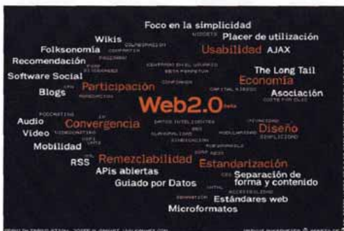
Nube de etiquetas de la web 2.0, por Markus Angermeier. Traducción de Josep M. Ganyet

El tagging o etiquetado por otra parte, permite a los internautas clasificar los contenidos (entradas en un blog, enlaces favoritos, etcétera) de forma libre, sin jerarquías, asignándoles términos o palabras clave denominados tags o etiquetas. La representación de estas etiquetas suele hacerse en forma de nube de etiquetas ( tag cloud ), una representación aleatoria de términos en la que los más empleados aparecen en una tipografía más destacada.