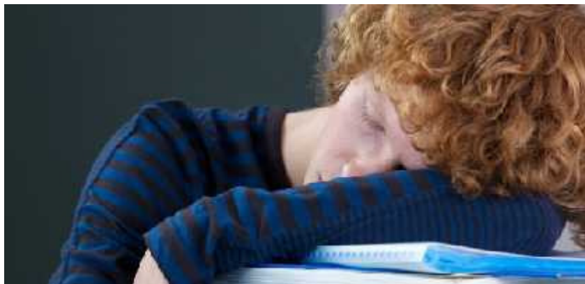
Ecce discipulum fatigatissimum more solito positum

Bonum mâne! Novâ disquisitione apparet multos adolescentes insomniâ laborare, quintum quemque minus sênis horis per noctem dormire. Adolescentes nimis diu vigilant nec surgunt nisi aegrê et dolorosê – etiam cum institutio scholaris incohetur praematurê – quod nocet valetudini.