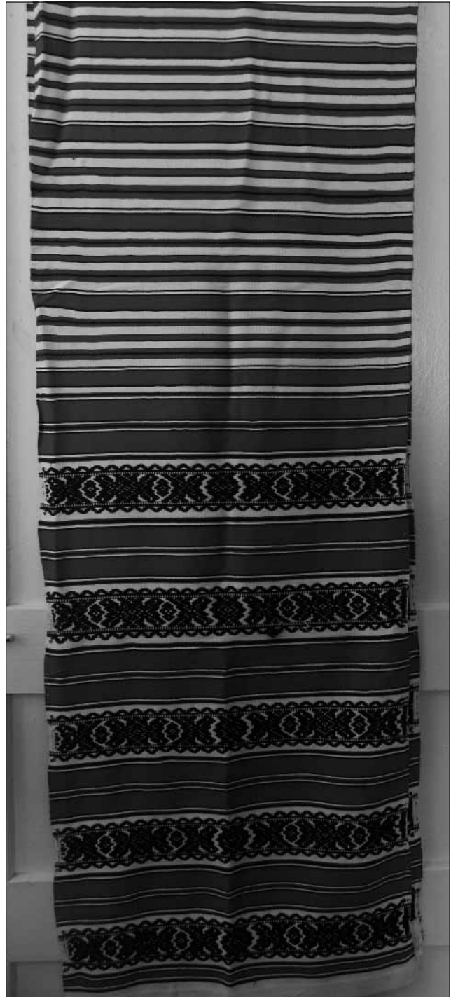
Рис. 5. Рушник тканій. Автор О.К. Бондарєва

8. Мірочка. Дерев'яна, виготовлена з семи клепок, які стягнуті двома дерев'яними обручами. Дно зроблене з двох клепок. Мірка має два виступи у вигляді невели-