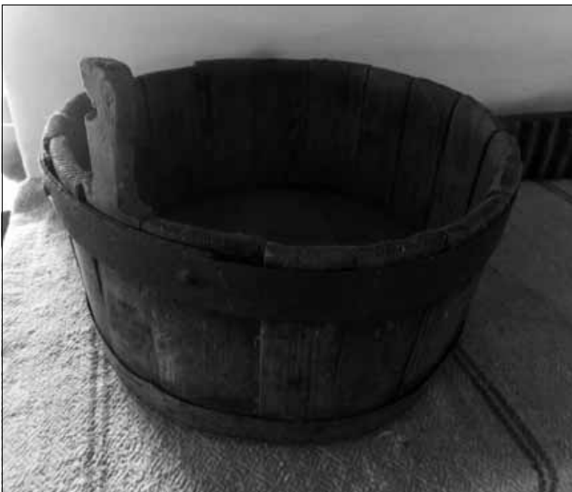
Рис. 2. Ряжка (помийниця)

прудка, Коленці, Феневичі, Термахівка, Обуховичі, Мусійки, Розважів, Сукачі, Прибірськ, Леонівка, Макарівка та з самого Іванкова. Ці музейні предмети систематизовані по різних фондових групах – етнографія, кераміка, різне, мистецтво, тканини. Крім того, на території музею Народної архітектури та побуту Середньої Наддніпрянщини розміщений будинок, перевезений з села Старовичі Іванківського району.