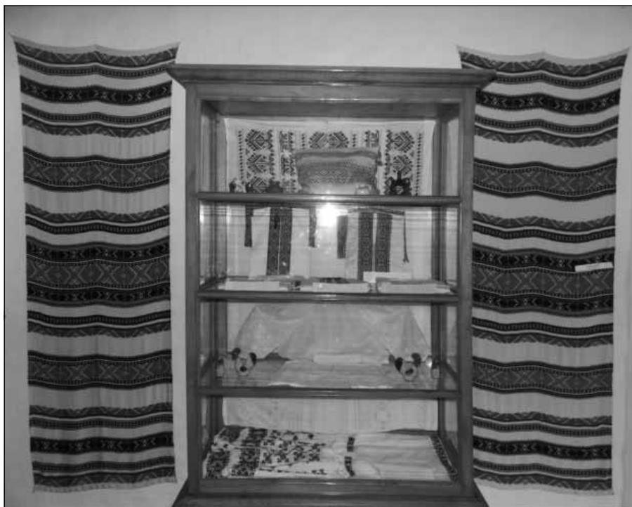
6. Рушник тканий. Автор Г.І. Верес

металевими обручами; одна з клепок закінчується ручкою. Дно зроблене з трьох клепок. Висота – 30 см, діаметр дна – 42 см, діаметр верху – 44 см. Зроблена Нестором Кононовичем Мусієнком у 30-х роках ХХ ст., який і передав її до музею у 1973 р. (рис. 2).