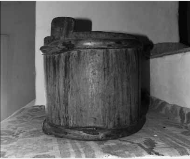
Рис. 1. Мірочка