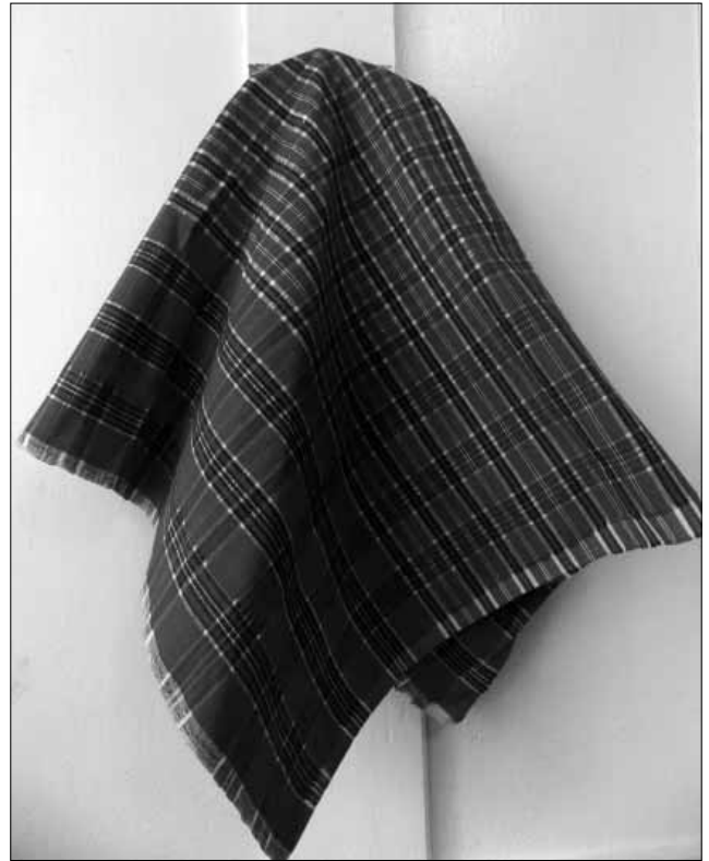
Рис. 3. Хустка

В Іванківському районі знаходиться с. Обуховичі, у якому з 1984 р. діє музей ткацтва, де представлені робо-