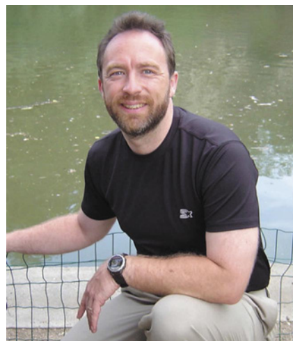
Джимми Уэйлс – создатель «Википедии»

Примерно в это же время в одном популярном компьютерном журнале была опубликована статья о Wikipedia, вызвавшая большой приток новых участников. Статья, написанная одним из администраторов русскоязычного раздела «Википедии», положила начало серии публикаций об энциклопедии и в других средствах массо-