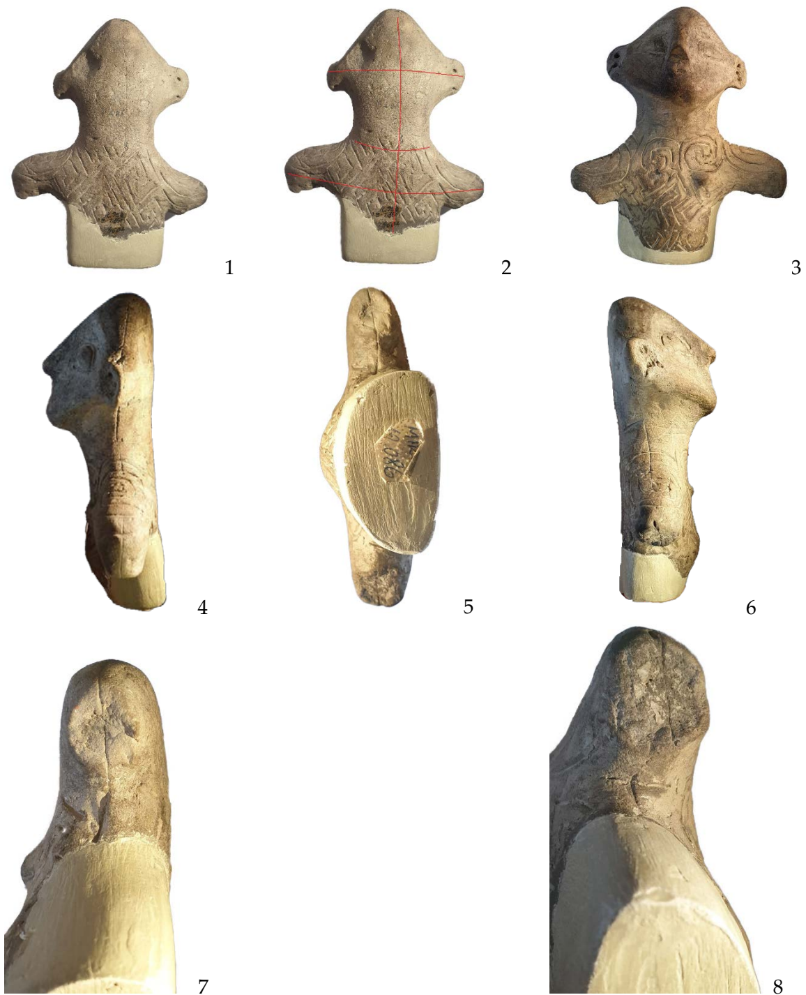
Pl. II. Figurină antropomorfă, Rast, jud. Dolj (1-2 - vedere posterioară; 3 - vedere anterioară; 4, 6 - vederi laterale; 5 - vedere inferioară; 7-8 - detalii ale membrelor, vedere inferioară). Anthropomorphic figurine, Rast, Dolj County (1-2 - posterior view; 3 - anterior view; 4, 6 - lateral views; 5 - lower view; 7-8 - limb details, lower view).